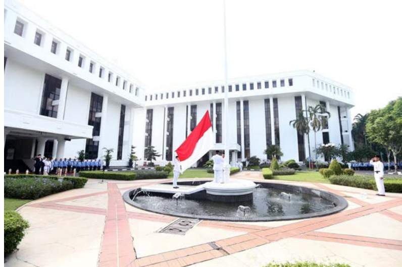
Gambar 2.2 Gedung Kementerian Sekretariat Negara

menjadi sebuah kementerian yang memberikan dukungan teknis, administrasi, dan analisis kepada Presiden dan Wakil Presiden.