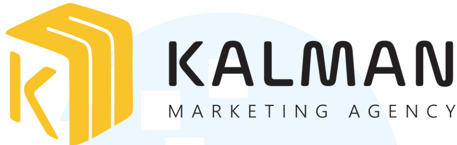
Gambar 2.1 Logo Kalman Marketing Agency

Logo dari perusahaan adalah sebagai berikut: