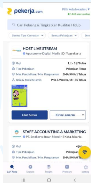
Gambar 2.3 Tampilan Aplikasi Pekerja.com

Aplikasi pekerja.com adalah aplikasi untuk membantu orang mencari lowongan kerja di perusahaan-perusahaan yang sudah terverifikasi, dan juga bisa untuk perusahaan untuk mencari karyawan. Selain aplikasi pekerja.com, juga terdapat media sosial Facebook dan Instagram untuk berbagai kota di Indonesia, di mana terus di- update tentang lowongan kerja di kota-kota tersebut.