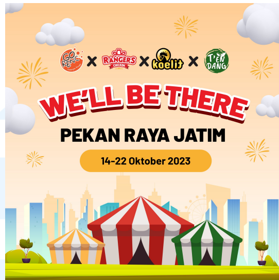
Gambar 2. 5 Gorenc x Rangers Chicken x Koelit x Tendang di Pekan Raya Jakarta Timur

Pada acara Pekan Raya Jakarta, Orang Tua Group beserta brand dan retailnya membuka booth yang menyediakan atau menjual makanan, minuman, personal care, hygiene dan sanitation, dan paket Orang Tua. Selain menjual makanan, Orang Tua group juga mengadakan games dan perlombaan untuk membuat pengunjung antusias.