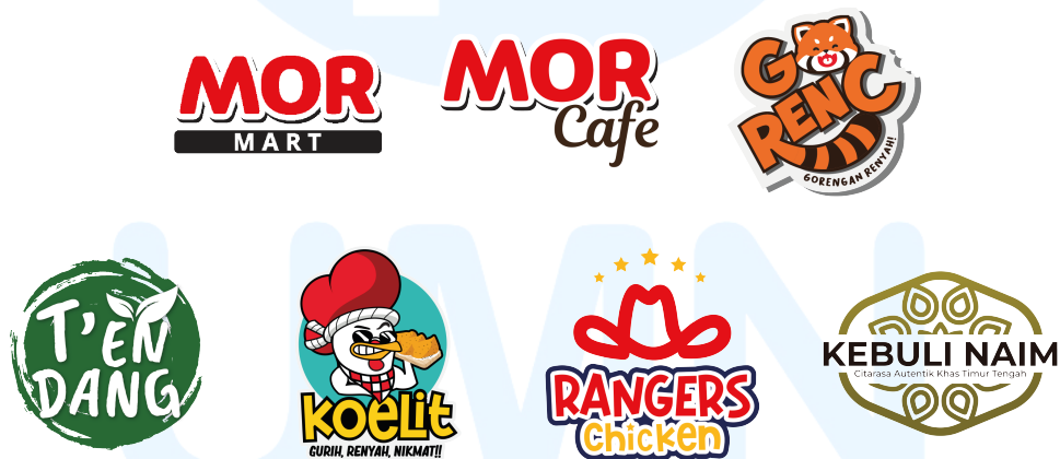
Gambar 2. 2 Brand di Bawah PT Moradi

Anak perusahaan Orang Tua (OT) Group yang dibawah naungan PT Moradi mendesain MOR sebagai sebuah ritel convenience store pertama yang asli dari Indonesia 100%. MOR ini tidak hanya menjadi tempat untuk makan dan belanja produk keseharian, tapi juga dapat menjadi tempat untuk mengobrol atau nongkrong dengan kualitas dan harga yang bersaing.