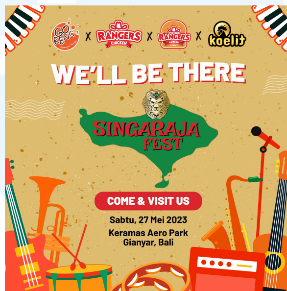
Gambar 2. 4 Gorenc x Rangers Chicken x Koelit di Singaraja Fest

Singaraja yang merupakan brand minuman beralkohol dari Orang Tua Group menggelar acara Singaraja Fest pada 27 Mei 2023 di Keramas Aero Park Gianyar, Bali. Acara ini digelar untuk memberikan apresiasi yang tinggi terhadap warga yang ada di pulau Dewata dan dukungan terhadap kreativitas local dari kesenian, musisi, UMKM, dan lainnya dengan konsep acara festival in the park .