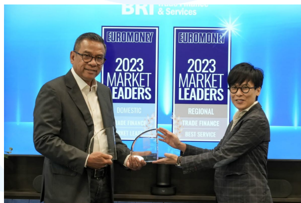
Gambar 2. 5 Penghargaan Euromoney Trade Finance Award 2023

Sebagai salah satu bank BUMN terbesar, BRI berkomitmen memberikan layanan optimal yang dibuktikan dengan berbagai penghargaan yang diterima setiap tahunnya. Pada tahun 2023, BRI telah meraih lebih dari 200 penghargaan, termasuk 53 penghargaan internasional. Salah satunya QLola mendapat pengakuan dalam Euromoney Cash Management Survey 2023 , dengan memenangkan kategori Cash Management Best Service and Cash Management Market Leader .