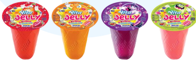
Gambar 2.6 Vita Jelly