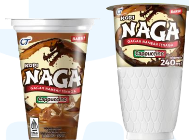
Gambar 2.14 Kopi Naga