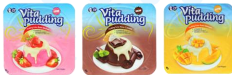
Gambar 2.7 Vita Pudding