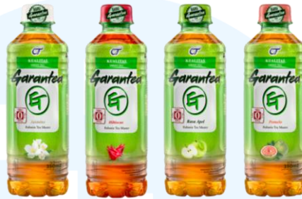
Gambar 2.5 Garantea