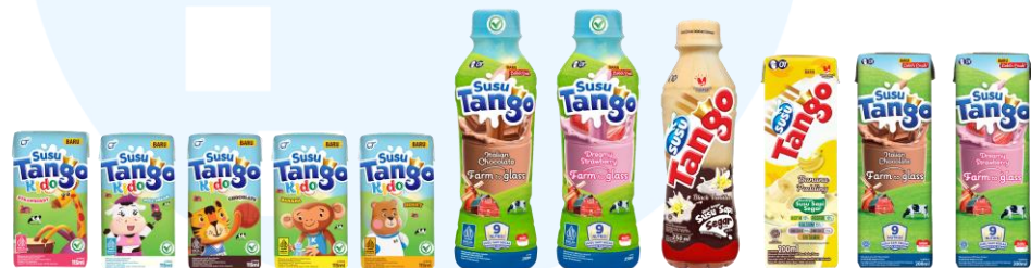
Gambar 2.11 Susu Tango