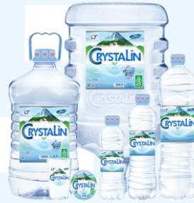
Gambar 2.8 Crystalin