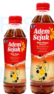
Gambar 2.4 Adem Sejuk