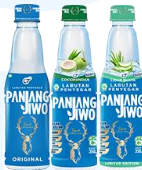
Gambar 2.9 Panjang Jiwo