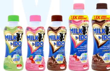
Gambar 2.12 Susu Milkido