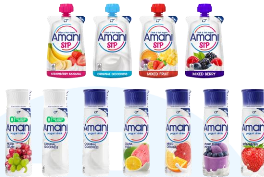
Gambar 2.10 Amani