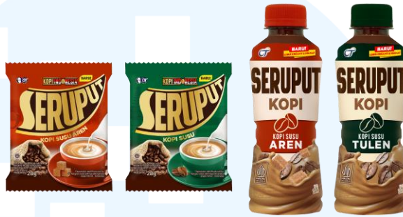
Gambar 2.13 Kopi Seruput