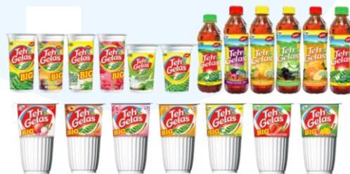
Gambar 2.3 Teh Gelas