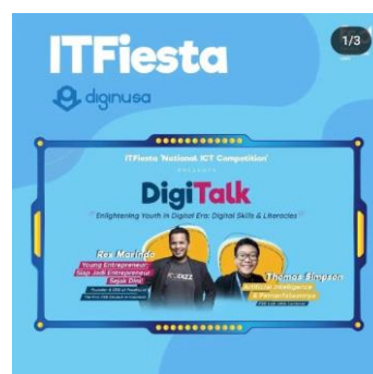
Gambar 2.6 ITFiesta with diginusa

Bukan hanya workshop bowen sutanto saja adanya rekan diginusa pada tahun 2021, yaitu kegiatan ITFiesta dengan tema workshopnya enlightening youth in digital era : digital skilly & literacles , dimana di workshop ini dengan rex mariando selaku founder & ceo of foodiz.id dan thomas simpson selaku FSD LAB UMN lecture . Yang menekankan bahwa penggunaan artificial intelligence penting di dunia yang akan datang.