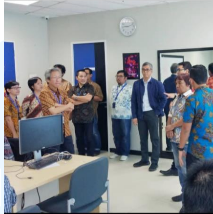
Gambar 2.7 Kunjungan Ban PT ke Render farm

adanya workshop dengan berbagai rekan lainnya sejak tahun 2020 hingga 2022 akhir.