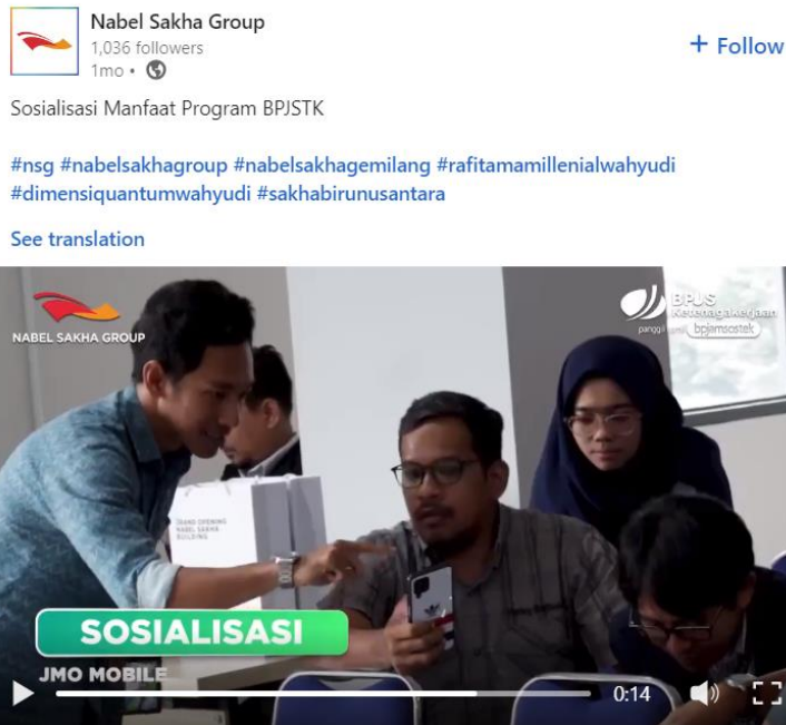
Gambar 2.3 Sosialisasi Manfaat Program BPJSTK