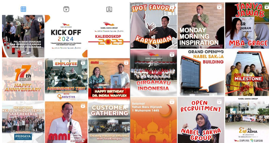
Gambar 2.2 Sosial media Nabel Sakha Group