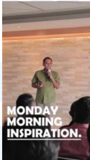
Gambar 2.4 Monday Morning Inspiration