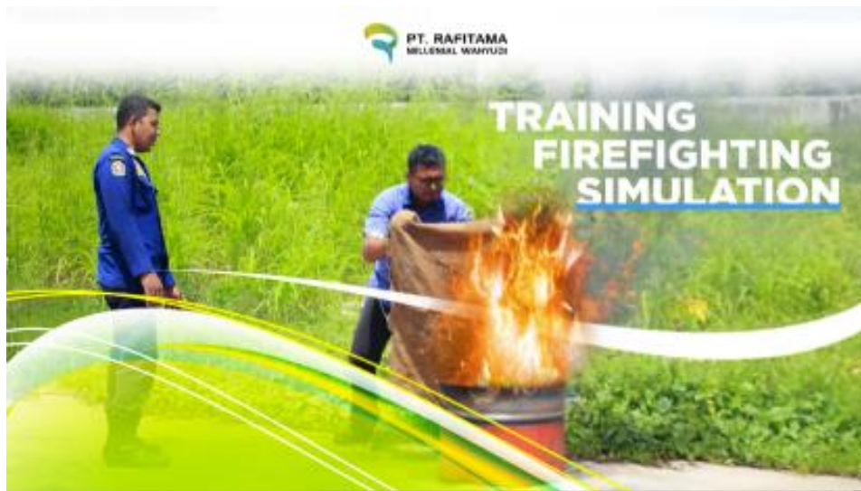
Gambar 2.5 Seminar Training Firefighting Simulator