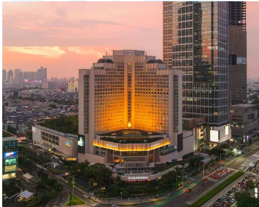
Gambar 2. 8 Grand Hyatt Jakarta

Sinar Mas Land memiliki hotel mewah bintang lima yaitu Grand Hyatt yang menjadi pilihan utama bagi para pelancong yang mengunjungi ibu kota Indonesia di Jakarta. Terletak strategis di pusat distrik bisnis, hotel ini menawarkan kemudahan akses bagi tamu yang ingin menjelajahi kekayaan budaya dan keindahan kota Jakarta.