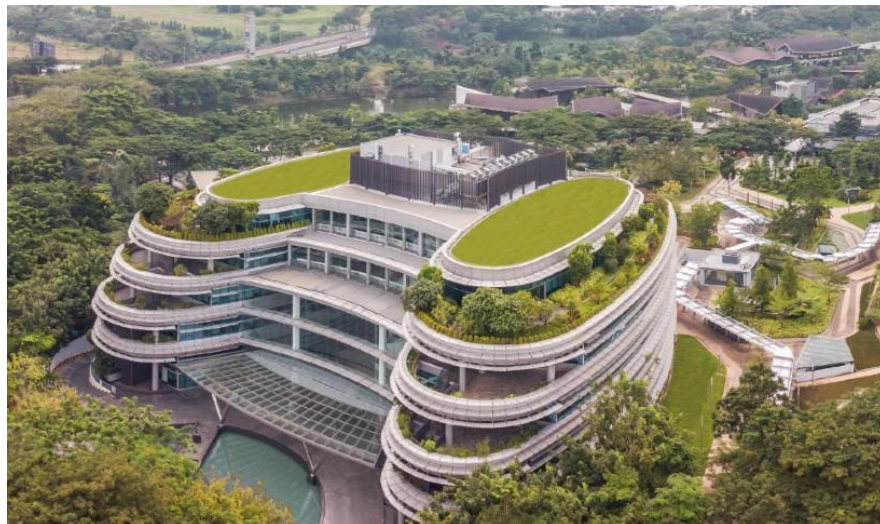
Gambar 2. 1 Sinar Mas Land Sumber: Dokumen Perusahaan

Melansir dari situs web Sinar Mas Land, Perusahaan ini merupakan salah satu Perusahaan property di terbesar Indonesia dengan berbagai macam proyek yang telah dicapainya. Pengalaman yang dimiliki Sinar Mas Land sendiri telah berjalan selama lebih dari 40 tahun, didirikan oleh Eka Tjipta Widjaja seorang pengusaha dan konglomerat ternama di Indonesia. Dan pada saat ini, CEO Sinar Mas Land sendiri adalah Michael Widjaja. Memiliki landbank strategis sekitar 10.000 hektar pada tahun 2011, Sinar Mas Land telah mengembangkan proyek-proyek perumahan, komersial, industri, dan perkotaan. Salah satu diantaranya township yang telah dikerjakan yang menjadi bagian dari pembentukan Sinar Mas Land adalah BSD (Bumi Serpong Damai) dan ada pula PT Dita Pertiwi, keduanya tercatat di bursa dengan kapitalisasi pasar lebih dari 2 miliar US Dollar.