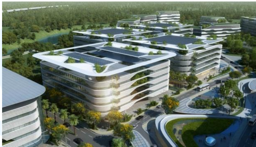
Gambar 2. 7 Digital Hub

Sinar Mas Land mengubah BSD City menjadi kota pintar digital terintegrasi dengan merilis Digital Hub di Green Office Park , BSD City, seluas 25,86 hektar. Digital Hub, sebagai inovasi mereka, menjawab kebutuhan akan kawasan dengan infrastruktur teknologi lengkap, fasilitas yang memadai, dan lokasi yang strategis.