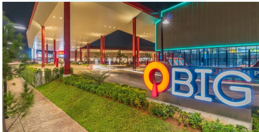
Gambar 2. 9 Qbig BSD City

Sinar Mas Land juga telah berhasil meraih penghargaan di Asia Pacific Property Awards 2017 untuk Nuvasa Bay ( Best Development Marketing ), serta QBig ( Best Retail Development ). QBig BSD City, sebuah kompleks ritel perkotaan baru, mengisi area seluas 17,5 hektar. Berkonsep sebagai pusat belanja yang komprehensif, dilengkapi dengan kanopi raksasa yang menjadi daya tarik.