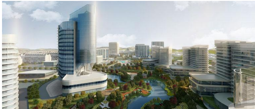
Gambar 2. 5 Kota Wisata Cibubur

Meskipun jauh dari hiruk-pikuk perkotaan, kota ini tetap dekat dengan berbagai fasilitas dan kebutuhan keluarga. Kota Wisata Cibubur diakui sebagai Pengembangan Kawasan Perumahan Terbaik di Wilayah Cibubur & Sekitarnya, menunjukkan keunggulan proyek township ini (Kota Wisata, 2024).