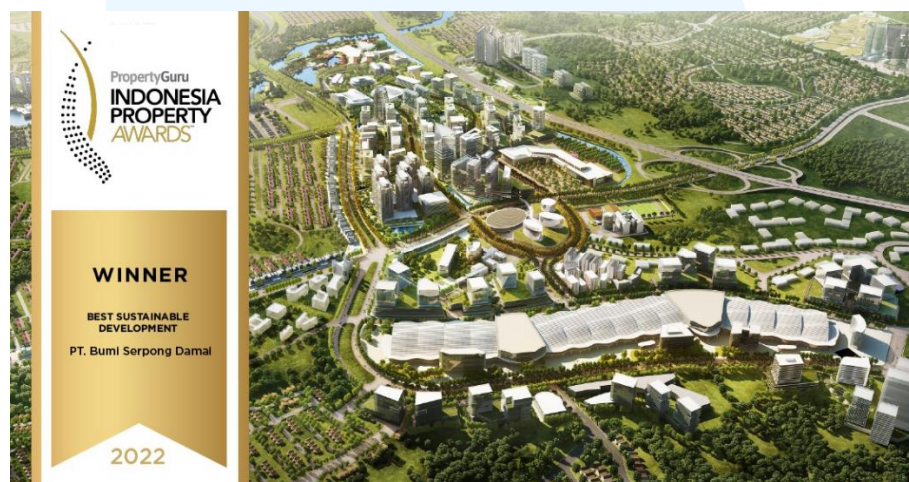
Gambar 2. 4 BSD City

properti komersial. Township ini meraih penghargaan “ Best of the Best City Scale Development ”. BSD City adalah sebuah kawasan perkotaan terintegrasi yang terletak di Tangerang Selatan, Indonesia. Dengan luas sekitar 6.000 hektar dan masih memiliki sebagian besar lahan yang perlu dikembangkan, BSD City merupakan salah satu proyek pengembangan terbesar di Indonesia. Kawasan ini terdiri dari berbagai jenis fasilitas dan infrastruktur seperti perumahan, perkantoran, pusat perbelanjaan, pendidikan, dan rekreasi.