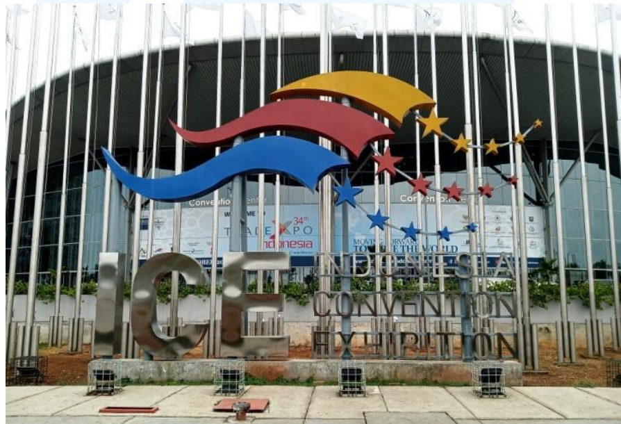
Gambar 2. 10 Indonesia Convention Exhibition (ICE)

Indonesia Convention Exhibition (ICE) yang terletak di BSD City merupakan sebuah proyek convention hall yang dimiliki oleh kolaborasi antara Sinar Mas Land dan Grup Kompas-Gramedia. Grup Kompas-Gramedia adalah perusahaan media dan penerbitan ternama di Indonesia, yang fokus pada penyediaan informasi dan pendidikan. ICE BSD City menjadi sorotan utama di atas lahan seluas 22 hektar, yang direncanakan akan menampung hingga 150.000 meter persegi ruang pameran serta fasilitas hotel.