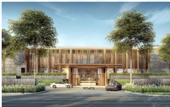
Gambar 2. 6 Enchante Residence

Enchante Residence di BSD City meraih penghargaan “ Best Prestigious Residential Region Tangerang & Surrounding ”. Enchante Residence menawarkan rumah-rumah mewah dan premium di lokasi pusat di BSD City . Rumah-rumah mewah, eksklusif, terampil, dan bergengsi ini dilengkapi dengan fitur dan fasilitas premium.