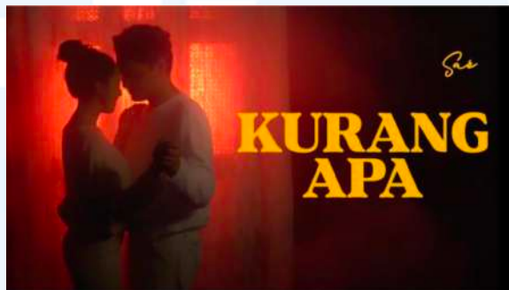
Gambar 2.4 Thumbnail Official Music Video “Kurang Apa”

Proyek ini adalah sebuah rilisan lagu single terbaru untuk comeback nya SAÉ pada 1 Maret 2024. YWMF mempunyai tim yang bertugas untuk memproduksi music video yang telah dibantu oleh Yovie Widiyanto sebagai producer dalam bagian audio dan executive producer selama pengerjaan music video “Kurang Apa”. Lagu ini dibuat untuk mempromosikan SAÉ sebagai artis yang mempunyai potensi dalam membuat lagu-lagu yang berkualitas.