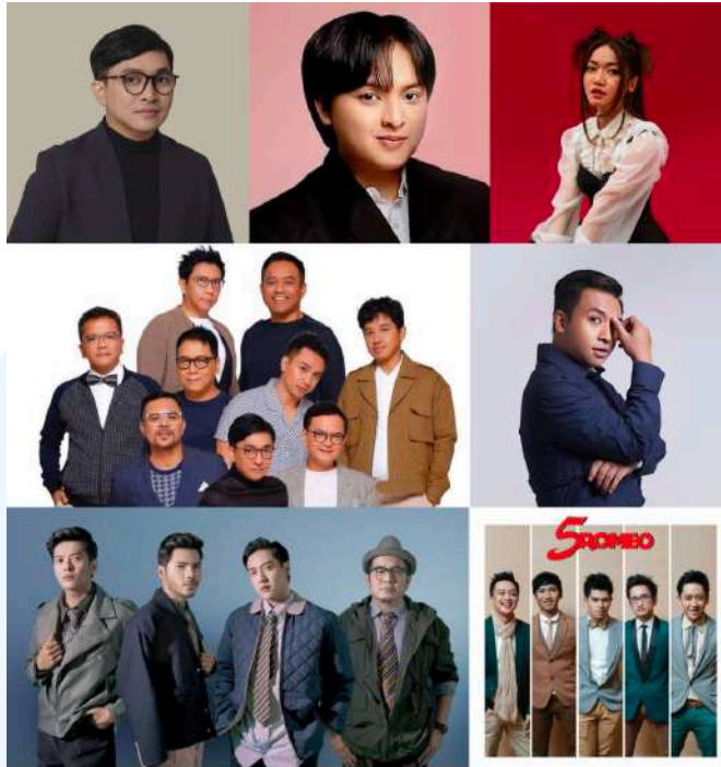
Gambar 2.2 Artis YWMF

Kantor YWMF memiliki 2 lokasi di daerah yang sama tetapi juga mempunyai fungsi yang berbeda. Salah satu kantor mempunyai fungsi untuk mengurus kebutuhan administrasi yang berada di Gedung Talavera Office Park Lantai 28, Jl. TB. Simatupang Kav. 22-26, Cilandak Barat, Cilandak, Jakarta Selatan 12430. Penulis sekarang berada di Jl. Al Barkah I No.28B, RT.9/RW.13, Cilandak Bar., Kec. Cilandak, Kota Jakarta Selatan, Daerah Khusus Ibukota Jakarta 12430. Kantor tersebut digunakan untuk divisi kreatif.