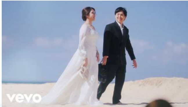
Gambar 2.5 Thumbnail Official Music Video “Lagu Pernikahan Kita”

Lagu tersebut mempunyai konsep di mana kita akan dapat menggambarkan rasa berdebar menuju akad nikah dan mempunyai akhir yang bahagia selamanya. Video tersebut juga mempunyai makna untuk menjaga satu sama lain serta selalu setia karena telah mengatakan ikrar janji suci yaitu perjanjian antara pasangan tersebut dengan Tuhan (Widianto, 2024).