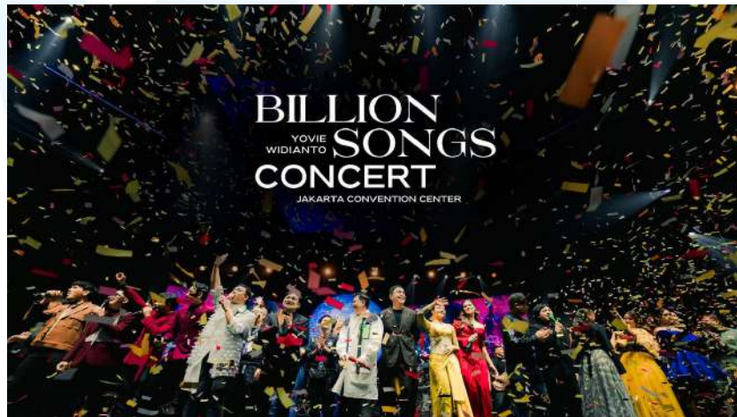
Gambar 2.8 Thumbnail Official Aftermovie “Billion Songs Concert 2023”