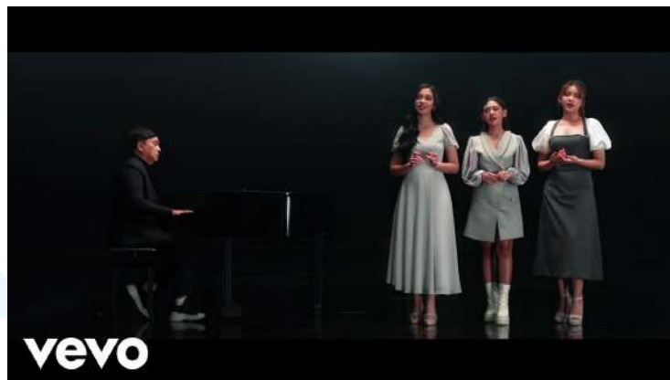
Gambar 2.7 Thumbnail Official Music Video “Menyesal” Sumber: https://www.youtube.com/watch?v=eXQwG8zmPDw

Musik ini merupakan sebuah rilisan lagu single dengan kolaborasi Yovie Widianto bersama tiga artis muda yaitu Lyodra, Tiara Andini, Ziva Magnolya untuk lagu berjudul “Menyesal” pada tanggal 3 Maret 2023. Lagu single ini akan menjadi lagu perdana dan juga pertama untuk proyek album Yovie & His Friends . Lagu tersebut akan di bawah perlindungan Label Universal Music Indonesia.