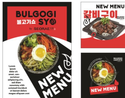
Gambar 2.5 Flyer & Instagram Post Bulgogi Syo

Selain fokus pada strategi pemasaran, Plenty juga merancang dan mengimplementasikan konten media sosial dan promotional media yang menarik dan sesuai dengan citra merek dari Bulgogi Syo. Untuk konten media sosial, platform utama yang digunakan merupakan Instagram dan Facebook. Plenty menyusun content plan , termasuk Instagram post dan Instagram stories yang interaktif dengan permainan atau kuis, untuk menciptakan suasana yang menyenangkan dan mengundang di dalam restoran. Semua konten ini dirancang untuk membangun keterlibatan audiens, meningkatkan kesadaran merek, dan mengundang pelanggan potensial untuk mengunjungi Bulgogi Syo. Setelahnya, Plenty juga merancang berbagai media cetak seperti banner, poster, dan flyer untuk menjadi media promosi bagi Bulgogi Syo.