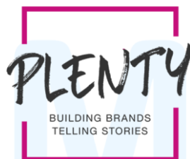
Gambar 2.1 Logo Plenty