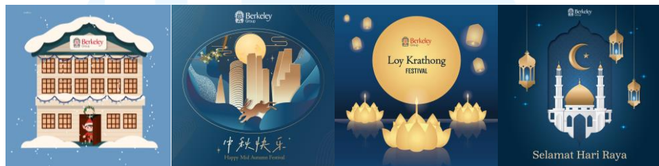
Gambar 2.8 Seasonal Greetings Berkeley Group Sumber: Dokumentasi Perusahaan (2024)

konten yang menarik dan relevan, yang dirancang untuk meningkatkan kehadiran merek dan keterlibatan konsumen secara online . Hal ini meliputi pengelolaan content plan setiap bulan, pengembangan strategi pemasaran digital, serta pelaksanaan kampanye promosi untuk memperkenalkan proyek-proyek perumahan baru dan meningkatkan kesadaran akan merek Berkeley Group di kalangan target pasar di wilayah tersebut.