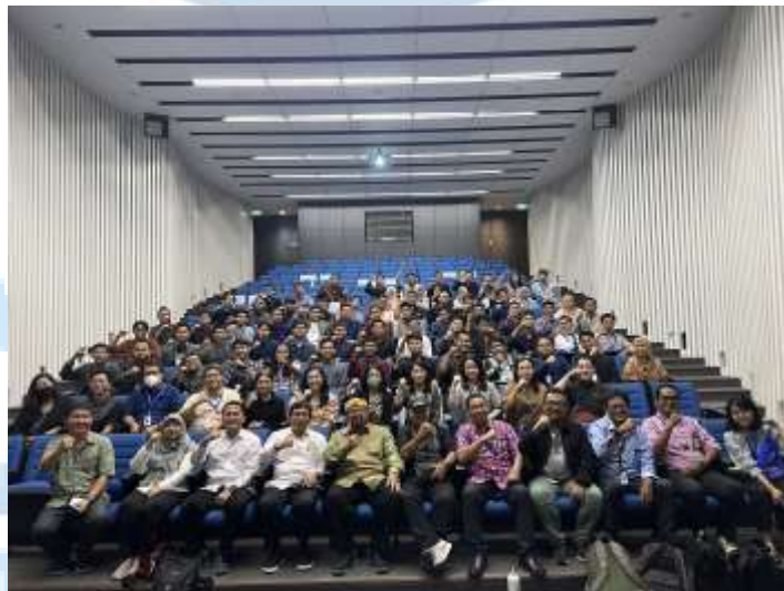
Gambar 2. 5 Dokumentasi Kerjasama Kemenag RI Sumber: CED 2024