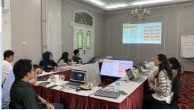
Gambar 2. 4 Dokumentasi Kerja Sama Karabha Digdaya