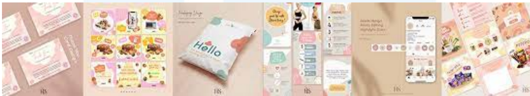
Gambar 2.2 Porfolio Henshu Studio (Dokumentasi Perusahaan)

memiliki tujuan untuk membantu suatu brand dalam pembuatan branding , website , social media , dan segalanya yang berhubungan dengan jasa graphic design . Setelah itu pada tahun 2023 Henshu Studio melakukan pembesaran team yang lalu tercipta Henshu Motion. Dalam team kerja, Henshu Studio dapat dikelompokkan menjadi tiga yaitu Henshu Photo, Henshu Design, dan Henshu Motion. Unit Henshu Photo memiliki peran dalam mengerjakan desain yang berhubungan dengan editing foto. Henshu Design memiliki peran dalam mengerjakan desain grafis dari berbagai permasalahan desain yang dibutuhkan oleh klien. Sedangkan Henshu Motion memiliki peran dalam pengerjaan desain motion dari berbagai permasalahan desain yang dibutuhkan oleh klien.