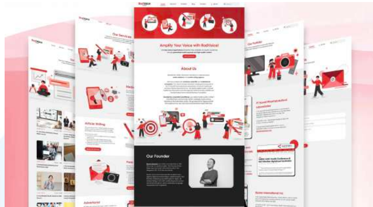
Gambar 2.6 Portfolio Henshu Studio Rad Voice (Dokumentasi Perusahaan)

Henshu Studio telah mendapatkan kepercayaan untuk mengerjakan proyek branding komprehensif bagi RadVoice, sebuah agen media relations dan content writing yang berbasis di Jakarta dan didirikan pada tahun 2022. Tugas Henshu Studio mencakup perancangan branding , desain situs web, ilustrasi, dan manajemen media sosial. Dengan fokus pada peningkatan profil dan kesadaran publik melalui konten yang berkualitas, RadVoice berupaya menjadi mitra strategis bagi berbagai organisasi dalam upaya mereka mencapai keberhasilan komunikasi.