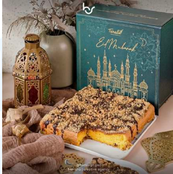
Gambar 2.8 Portfolio Henshu Studio Tarrale Bakehouse (Dokumentasi Perusahaan)

Tarrale Bakehouse adalah sebuah kafe dan toko roti yang terletak di kota Bandung, terkenal dengan suasana yang hangat dan pilihan produk yang menggugah selera. Di Tarrale Bakehouse, pengunjung dapat menikmati berbagai macam pastry , pencuci mulut, hidangan utama, hingga berbagai jenis minuman yang disiapkan dengan penuh cinta dan perhatian terhadap detail. Setiap produk yang ditawarkan tidak hanya memanjakan lidah tetapi juga memberikan pengalaman kuliner yang menyenangkan. Dengan beragam pilihan menu, Tarrale Bakehouse menjadi destinasi favorit bagi pecinta kuliner yang mencari kualitas dan rasa autentik di setiap gigitan.