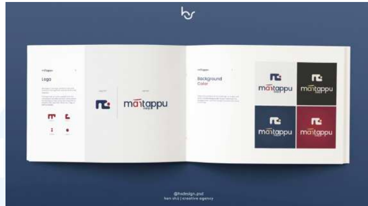
Gambar 2.4 Portfolio Henshu Studio Mantappu Corp (Dokumentasi Perusahaan)

Henshu Studio telah dipercaya untuk merancang identitas visual yang kuat dan kohesif bagi Mantappu Corp, sebuah perusahaan talent management yang mengelola berbagai content creator terkemuka di Indonesia. Dalam proyek ini, Henshu Studio bertanggung jawab atas desain logo, stationery , dan berbagai elemen brand collateral lainnya. Logo yang diciptakan dirancang agar modern dan menarik secara visual, sekaligus mencerminkan visi dan misi Mantappu Corp. Pemilihan warna dan tipografi yang tepat memastikan logo tersebut mudah diingat dan dikenali.