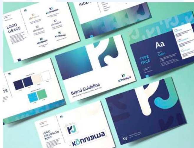
Gambar 2.5 Portfolio Henshu Studio Konnjiwa

Henshu Studio telah dipercayakan dengan tugas penting dalam merancang identitas visual yang kohesif dan menarik bagi Konnjiwa, sebuah perusahaan talent management agency yang berdiri sejak tahun 2023. Konnjiwa berfokus pada penyediaan dukungan bagi content creator muda di Indonesia, membantu mereka mengembangkan karir dan meningkatkan kualitas konten yang mereka hasilkan. Dalam proyek ini, Henshu Studio bertanggung jawab atas berbagai aspek desain mulai dari logo, stationery , hingga berbagai elemen brand collateral lainnya. Tujuan utama dari proyek ini adalah menciptakan identitas visual yang