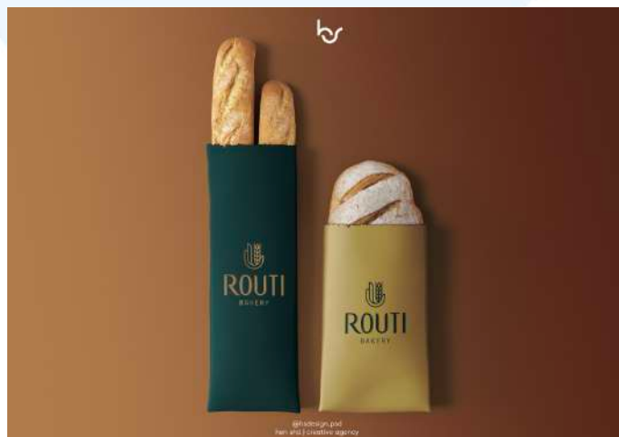
Gambar 2.7 Portfolio Henshu Studio Rouiti

Routi adalah sebuah toko roti tradisional yang menggabungkan nuansa modern dalam setiap aspeknya. Dengan beragam produk pastry yang menggugah selera, Rouiti menawarkan berbagai jenis roti tawar, roll cake, kue kering, dan masih banyak lagi. Filosofi Rouiti adalah menyajikan kualitas terbaik dengan sentuhan inovatif, sehingga setiap produk yang dihasilkan tidak hanya lezat tetapi juga memiliki tampilan yang menarik.