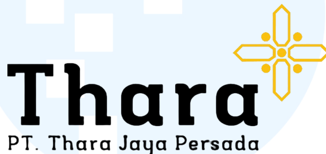
Gambar 2. 1 Logo PT. Thara Jaya Persada

PT. Thara Jaya Persada didirikan pada tahun 2019, PT. Thara Jaya Persada merupakan perusahaan multi usaha dan berskala nasional yang bergerak pada bidang usaha pengadaan umum, event organizer, food & beverages, pemeliharaan gedung dan taman, serta transportasi.