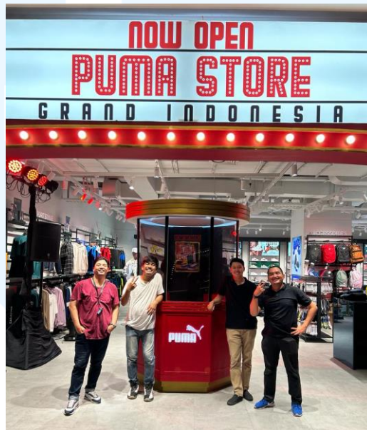
Gambar 2. 4 Project booth opening Puma store Grand Indonesia Mall

Brand olahraga PUMA, membuka gerai flaship terbarunya di Grand Indonesia Mall, Jakarta, dan menjadi gerai flagship ketiga PUMA setelah Pondok Indah Mall dan Senayan city, Thara Production mendapatkan kepercayaan dalam projek booth opening PUMA Store setelah berhasil pada gerai Senayan City.