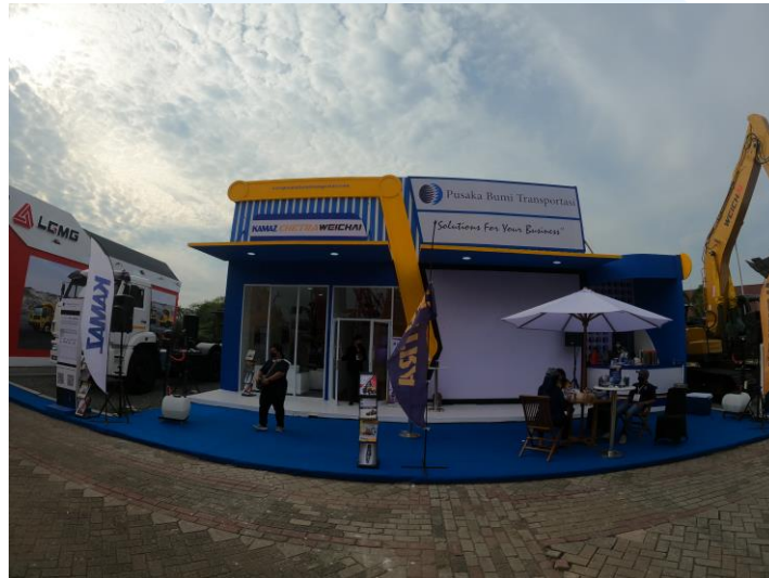
Gambar 2. 3 Project Booth Mining Expo PT. Pusaka Bumi Transportasi

Pusaka Bumi Transportasi merupakan perusahaan yang dibina oleh salah satu perusahaan transportasi terbesar di Indonesia dan kawasan Asia, Blue Bird Group. Perusahaan ini telah berkembang dengan dua keahlian bisnis mendasar yaitu jasa pertambangan dan dealer alat berat. Tujuan dari dibuatnya booth pameran ini adalah untuk meningkatkan kesadaran merek, mejaring pelanggan potensial, dan meningkatkan penjualan atau produk yang ditawarkan perusahaan.