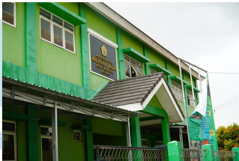
Gambar 2.5 Foto dokumentasi sekolah yang terdapat di Desa Medang

Foto ke – empat merupakan foto dari salah satu sekolah yang terdapat di Desa Medang, yaitu Madrasah Miftahul Huda Medang, yang berlokasi di Homson Raya No.Kelurahan, Medang, Kec. Pagedangan, Kabupaten Tangerang, Banten 15334.