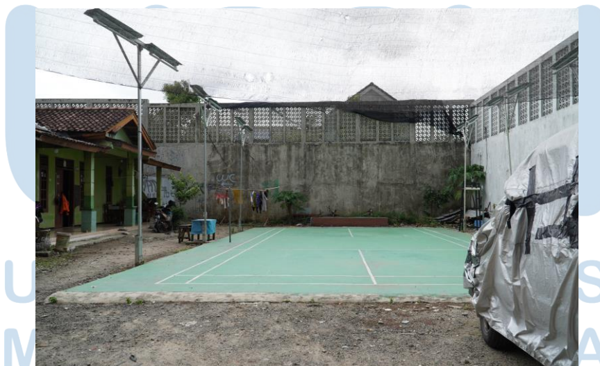
Gambar 2.3 Foto dokumentasi Lapangan Desa Medang

Foto ke – dua merupakan foto dokumentasi yang penulis ambil di kawasan Medang, yang merupakan lapangan yang biasa digunakan sebagai tempat kumpul warga setempat.