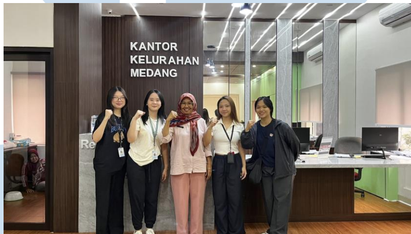
Gambar 2.1 Foto Dokumentasi Proyek Desa Medang

Desa Medang merupakan salah satu bagian desa yang termasuk di dalam Kawasan Summarecon Serpong, desa medang ini sendiri merupakan desa yang unggul dalam segi sumber daya manusia dan lingkungan, pada saat mengunjungi Desa Medang.