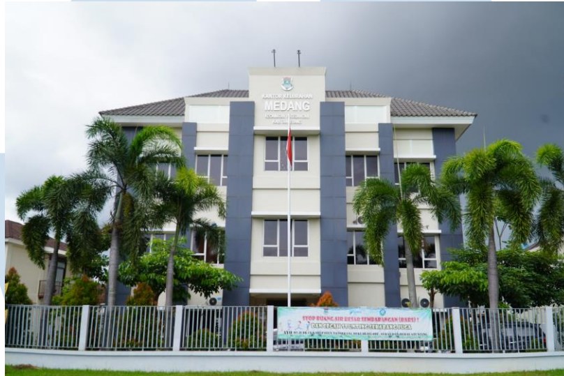
Gambar 2.2 Foto dokumentasi Kantor kelurahan medang

Foto pertama merupakan foto dokumentasi dari Kantor Kelurahan Medang yang terdapat di Jl. Scientia Boulevard No. 001 Kelurahan Medang Kec. Pagedangan.