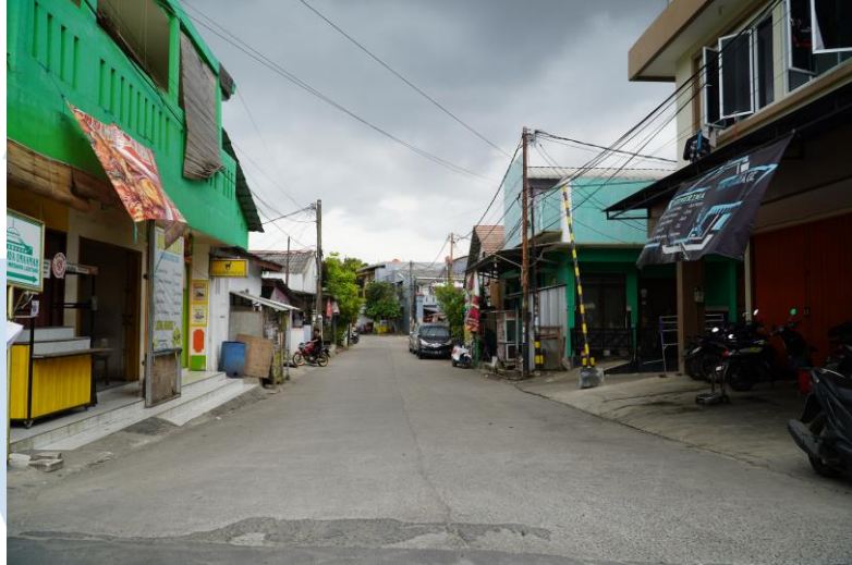
Gambar 2.4 Foto dokumentasi keadaan jalan

Foto ke – tiga, merupakan foto jalanan sekitar Desa Medang, terdapat banyak tempat yang menjual makanan, foto ini diambil di jalan sekitar UMKM Nyeblok Seuhah, dan Raja Lontong.