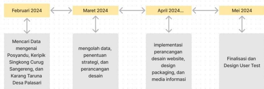
Gambar 3.3 Roadmap Tahapan Kegiatan

Berikut merupakan gambaran roadmap perancangan tahapan kegiatan program MBKM Cluster Proyek Desa yang telah penulis dan kelompok sepakati bersama.