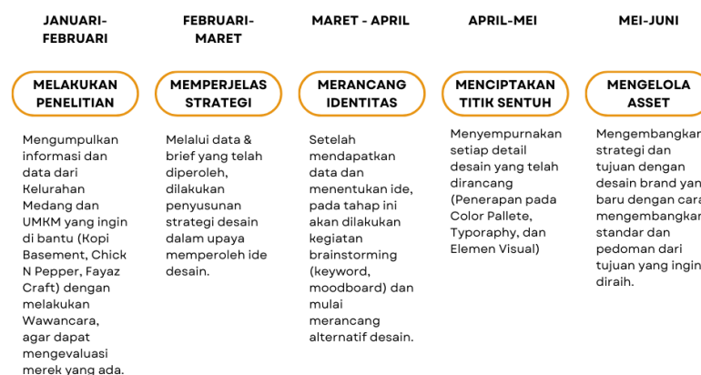
Gambar 3. 3 Roadmap / tahapan kegiatan MBKM Cluster Proyek Desa

Pelaksanaan program MBKM Cluster Proyek Desa mengacu pada tahapan perancangan yang didasari oleh Alina Wheeler dalam bukunya yang berjudul “Designing Brand Identity” (2018, 120-197). Lima tahapan yang dilakukan saat perancangan desain adalah conducting research (melakukan penelitian), clarifying strategy (memperjelas strategi), designing identity (merancang identitas), creating touchpoints (menciptakan titik sentuh), dan managing assets (mengelola aset).