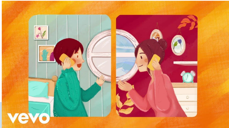
Gambar 2. 7 ArTi - Memilih Aku (Lyrics Video)

Lagu ini diciptakan oleh Yovie Widiyanto dan dinyanyikan secara kolaboratif oleh Arsy Widiyanto dan Tiara Andini. Video lirik dari lagu ini dikerjakan oleh tim dari YWMF. Mulai dari konsep, aset visual, hingga motion dilakukan oleh YWMF dengan arahan dari Yovie Widiyanto.