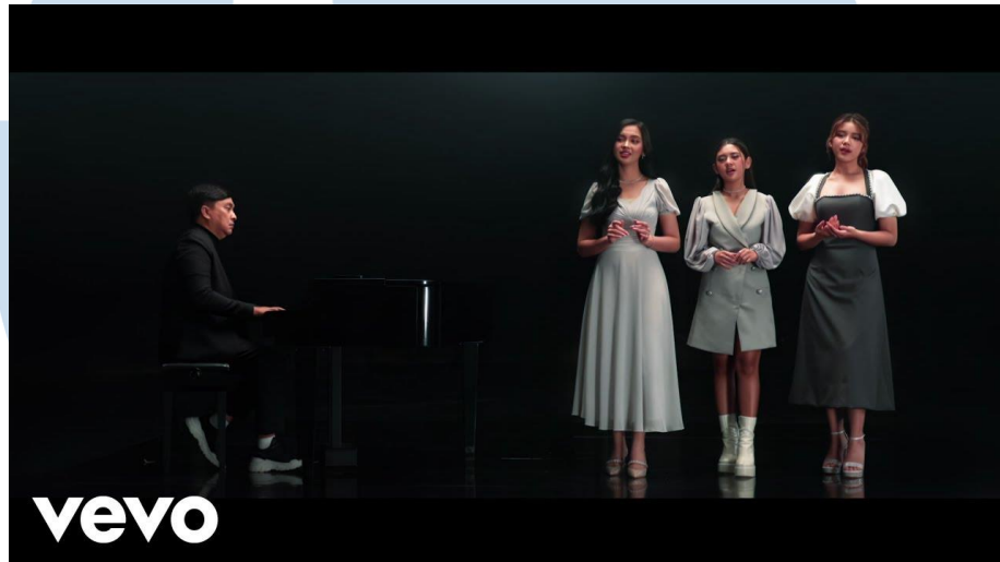
Gambar 2. 4 Yovie Widiyanto x LTZ – Menyesal

Rilisan lagu dari Yovie Widiyanto yang dirilis pada tahun 2023 lalu merupakan salah satu proyek yang dikerjakan oleh YWMF. Lagu ini merupakan kolaborasi dari Yovie Widiyanto dengan 3 penyanyi muda berbakat yaitu Lyodra, Ziva Magnolya, dan Tiara Andini.