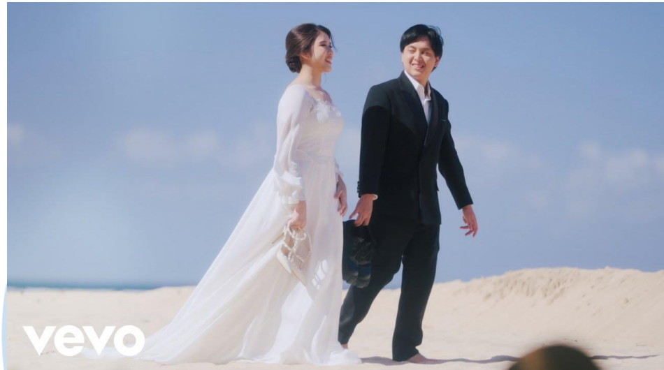
Gambar 2. 6 ArTi - Lagu Pernikahan Kita

Menurut Yovie Widiyanto pada press conference , Ia turut menggarap aransemen dari lagu ini, dan menurutnya Lagu Pernikahan Kita ingin menggambarkan perasaan berdebar menuju akad nikah dan menuju akhir yang bahagia. Music video dari lagu ini juga memiliki makna untuk menjaga satu sama lain dan untuk selalu setia selamanya lewat ikrar janji suci, yaitu perjanjian kedua pasangan tersebut dengan Tuhan (Widiyanto, 2024).