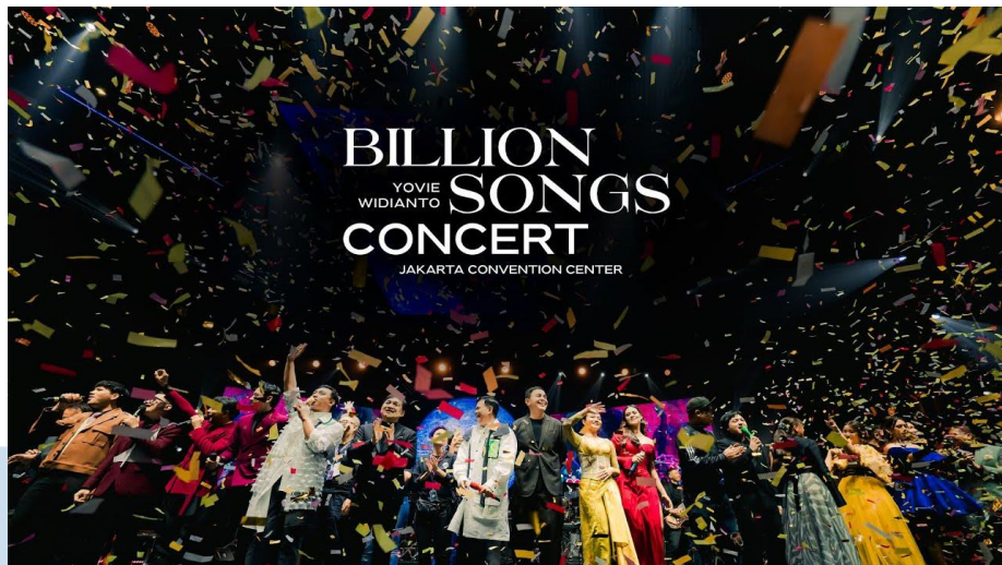
Gambar 2. 5 The Billion Songs Concert

The Billion Songs Concert digelar untuk merayakan karya dari Yovie Widianto yang sudah didengar lebih dari 1,7 miliar kali di platform streaming digital . Konser ini juga diisi oleh artis-artis Indonesia lainnya seperti Raisa, Yura Yunita, Lyodra Ginting, Tiara Andini, Ziva Magnolya, dan Rossa.