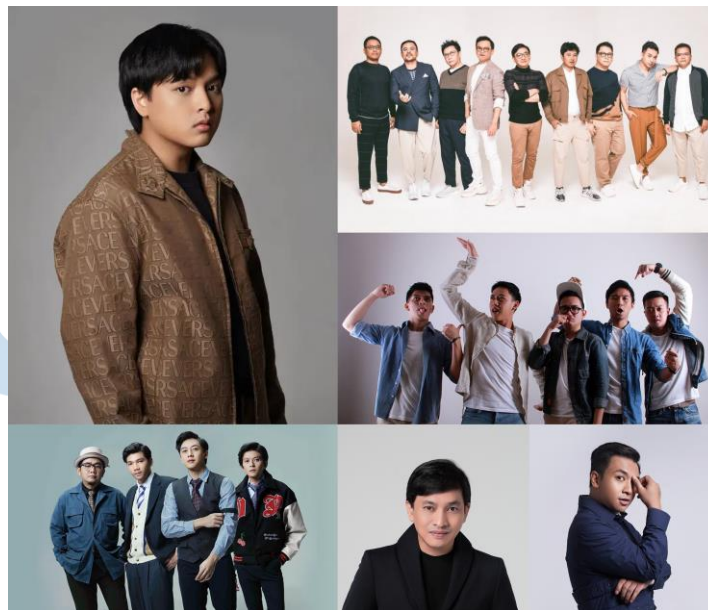
Gambar 2. 1 Artis dibawah naungan YWMF

Sejak didirikan pada tahun 1994, YWMF menjadi garda terdepan dengan mengelola salah satu band yang ternama di Indonesia, Kahitna. Seiring perkembangannya selama bertahun-tahun, YWMF kini semakin berkembang menjadi perusahaan yang menyediakan layanan mulai dari manajemen artis, label rekaman, publishing , creative development , brand , dan korporasi. YWMF mengambil namanya dari virtuoso seorang penulis lagu, komposer, produser, arranger , keyboardis, dan pianis ternama, yaitu Yovie Widiyanto. YWMF menjalankan bisnis di bidang ini dengan semangat dan jiwa dari nama yang sudah menciptakan kreasi, kolaborasi, dan prestasi yang telah dicapai selama bertahun-tahun. YWMF merupakan label yang menaungi berbagai artis seperti Kahitna, Mario Ginanjar, Arsy Widiyanto, Yovie & Nuno, 5 Romeo, dan tentunya Yovie Widiyanto sendiri.