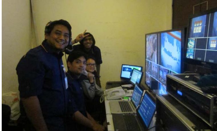
Gambar 3. 2 Suasana MCR di Ballroom Hotel Gumaya