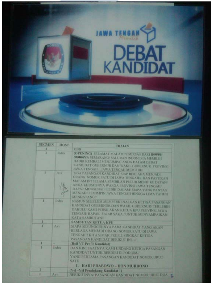
NUSANTARA Gambar 3.1 Cue Card