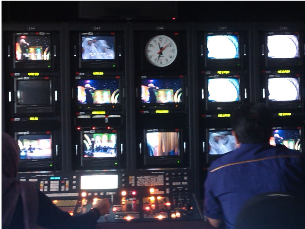
Gambar 3. 3 Suasana MCR Grand Studio Metro TV Saat Syuting Syair Syiar