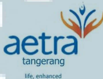
Gambar 1.1 Logo Perusahaan PT Aetra Air Tangerang