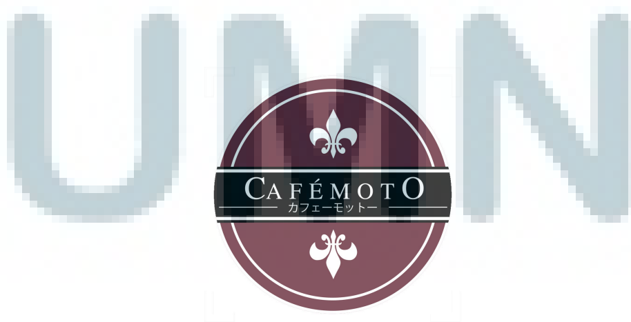
Gambar 2.1 Logo Cafemoto Photography