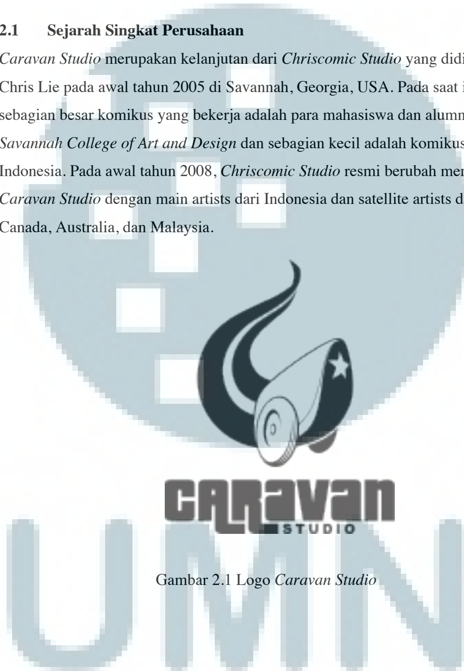
Gambar 2.1 Logo Caravan Studio