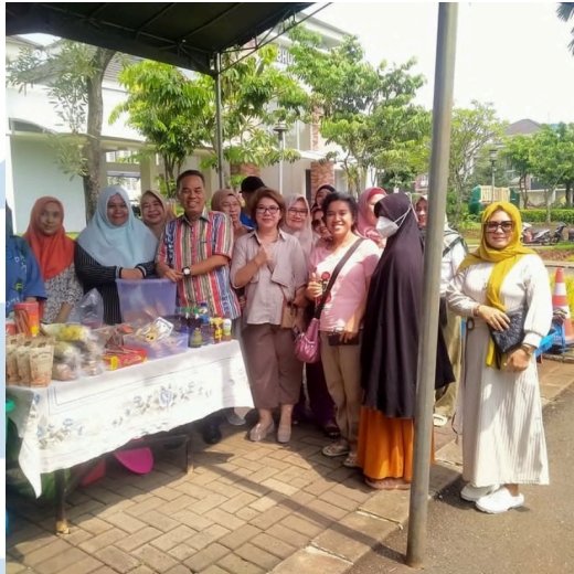
Gambar 2.1 Foto Kebersamaan Warga Desa