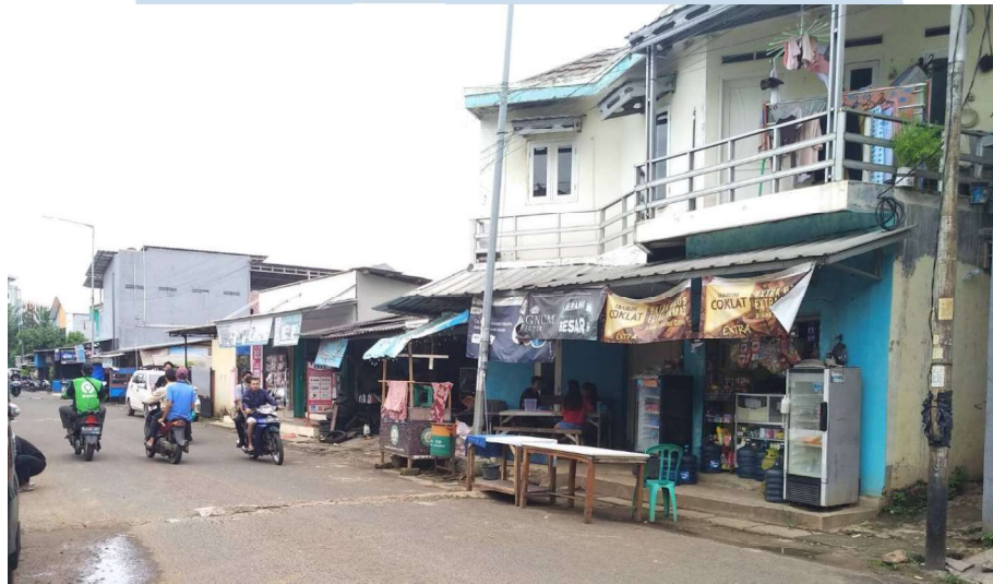
Gambar 2.2 Foto Warung di Desa Curug Sangereng

Karakteristik masyarakat tersebut juga mendorong aparat desa dalam mewujudkan program-program desa, sebagai contoh produk UMKM desa dapat dijual pada warung-warung yang terdapat di Desa Curug Sangereng dengan mudah dikarenakan masyarakat sudah mengenal satu sama lain, penjualan produk UMKM desa juga dipasarkan melalui whatsapp dimana masyarakatnya hampir semua terhubung satu sama lain.