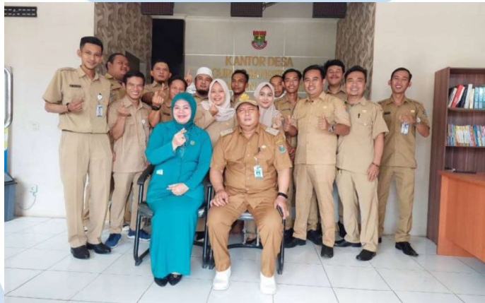
Gambar 2.1 Foto Dokumentasi Aparatur Desa

Desa Curug sangereng merupakan satu-satunya desa diantara 5 kelurahan yang berada di Kecamatan Kelapa Dua Tangerang. Terbentuk pada tahun 1983, saat itu Desa Curug Sangereng merupakan hasil pemekaran dari Desa Cihuni dan masuk kedalam Kecamatan Legok. Pada tahun 2007 Desa Curug Sangereng resmi masuk kedalam wilayah Pemerintahan Kecamatan Kelapa Dua, Kabupaten Tangerang. Lingkungan Desa Curug Sangereng awalnya adalah perkebunan dan peternakan, namun dikarenakan adanya pembangunan diatas lahan-lahan desa, mayoritas masyarakat desa mulai beradaptasi dengan perubahan tersebut, sehingga menyebabkan penduduk desa banyak bekerja sebagai karyawan, pengusaha, berdagang, dan menawarkan berbagai jasa yang dibutuhkan.