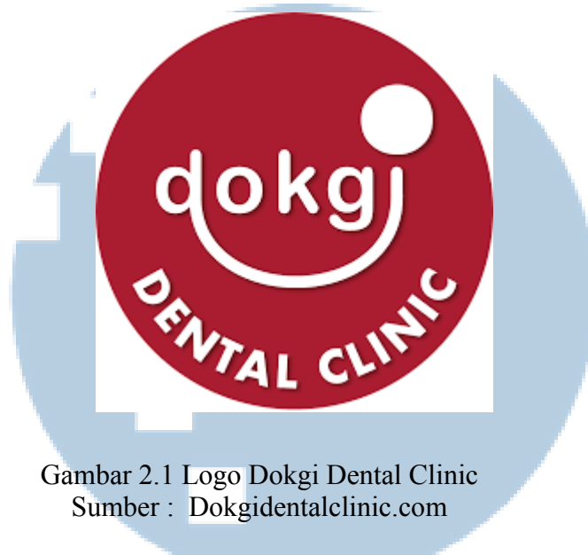
Gambar 2.1 Logo Dokgi Dental Clinic

Klinik gigi Dokgi telah beroperasi sejak tahun 2016 dan menjadi klinik gigi pertama di wilayah Cisauk, Tangerang, Banten. Hingga saat ini, Dokgi telah dipercaya oleh lebih dari 20.000 pasien. Saat ini, Dokgi memiliki dua cabang, yaitu Dokgi dental clinic Cisauk dan Dokgi dental clinic BSD. Dengan konsep sebagai klinik gigi keluarga yang sesungguhnya, Dokgi telah siap untuk memberikan pelayanan kepada pasien dari berbagai rentang usia dengan dukungan dari dokter gigi yang ahli di bidangnya masing-masing.