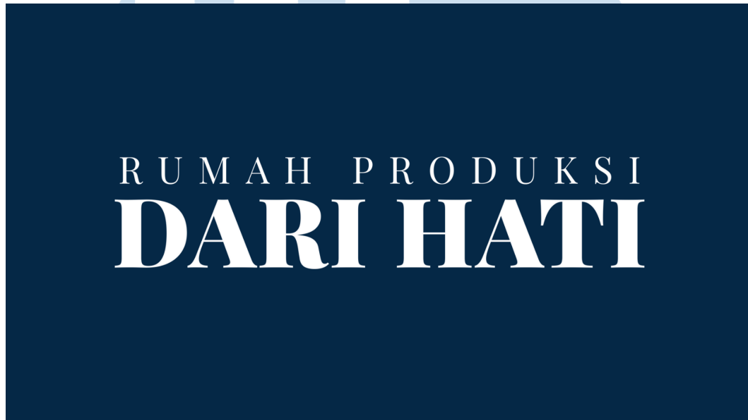
Gambar 2.1 Logo Rumah Produksi Dari Hati