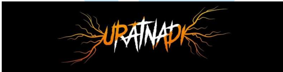
Gambar 2.1 Logo Studio Uratnadi Visual Works

Studio Uratnadi Visual Works adalah studio yang berdiri semenjak 2020 berdomisili di Jakarta Selatan Radio dalam. Sebuah studio yang dipimpin oleh kedua rekan CGI artist yang telah memasuki industri VFX ( Visual Effect ) semenjak 2011. Lingkup proyek studio Uratnadi termasuk, animasi, VFX & motion graphics , desain grafis, ilustrasi, dan juga konten digital seperti video kebutuhan sosial media dan elemen visual lama situs. Berikut merupakan logo dari studio Uratnadi Visual Works pada gambar 2.1.