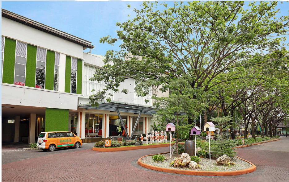
Gambar 2.1 HARRIS Hotel & Residences Sunset Road Bali