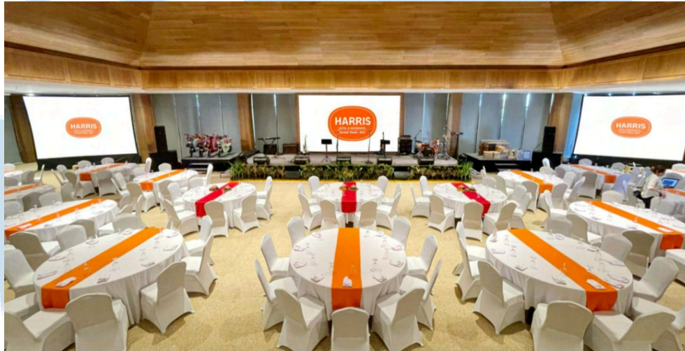
Gambar 2.6 Kecak Grand Ballroom

theater setup , 30 pax untuk round table setup , 36 pax untuk classroom setup , 21 pax untuk u-shape setup dan 18 pax untuk boardroom setup .