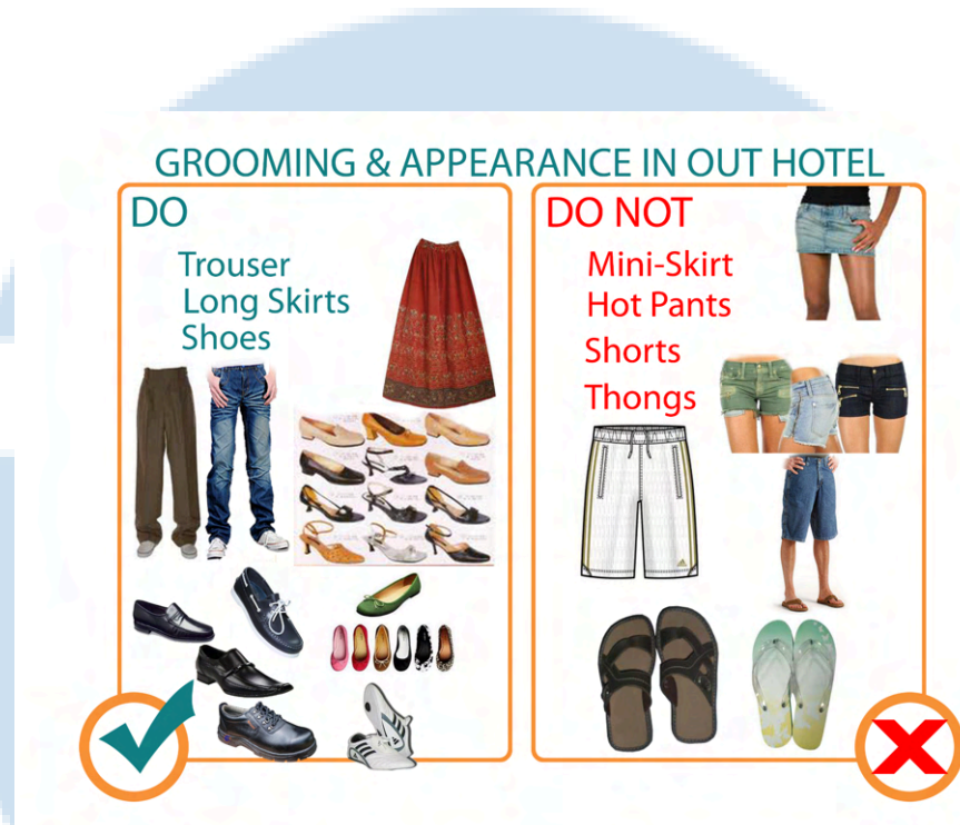
Gambar 2.8 Do & Don't Grooming Guideline