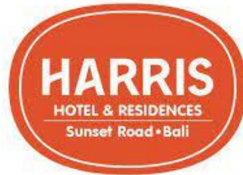
Gambar 2.4 Logo HARRIS Hotel & Residences Sunset Road Bali