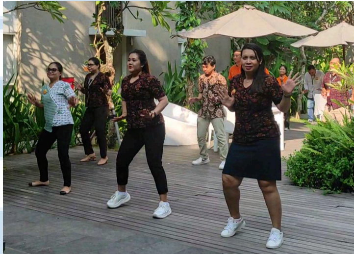
Gambar 2.7 Harris Move