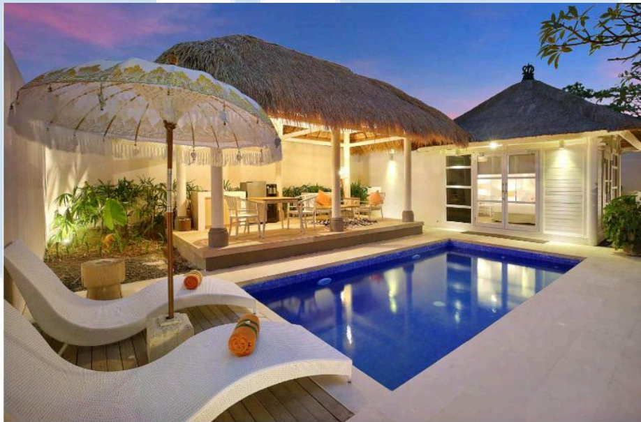
Gambar 2.5 Villa Lily

Bedroom) merupakan private villa yang memiliki 2 kamar tidur dengan double bed pada setiap kamarnya, dengan luas kamar 229 meter persegi. Villa ini terdapat microwave , kulkas, mini kitchen set (kompor portable serta alat untuk memasak), 32” LCD TV pada setiap kamar, safety deposit box , coffee tea maker , hairdryer , wardrobe , private pool , bathtub , dan ruang tamu.