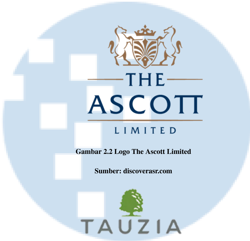
Gambar 2.2 Logo The Ascott Limited