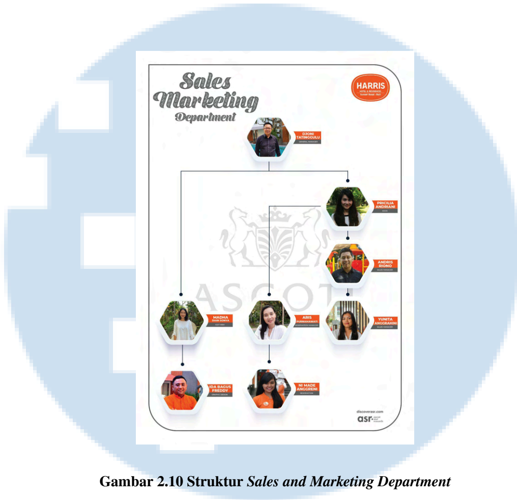
Gambar 2.10 Struktur Sales and Marketing Department