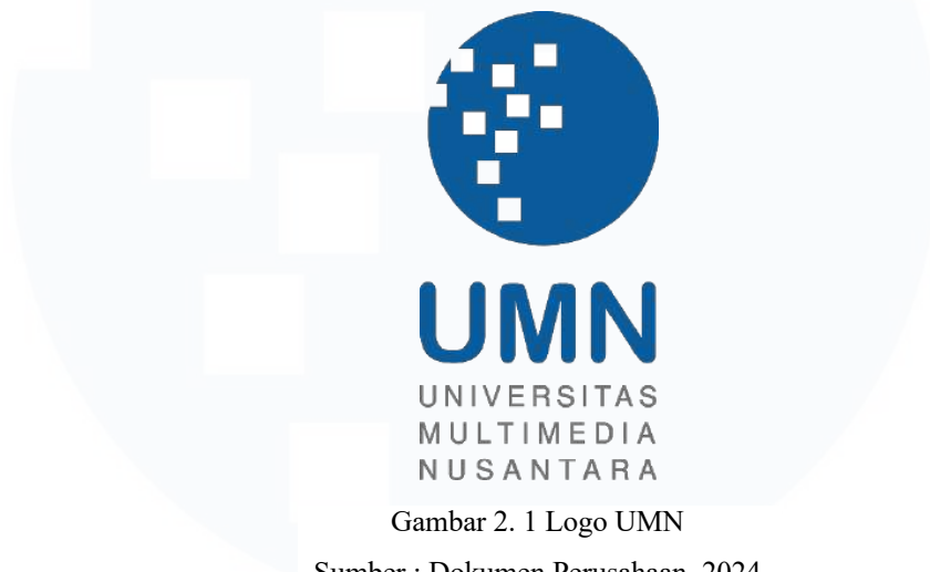
Gambar 2. 1 Logo UMN

Setiap perusahaan pasti memiliki logo yang memiliki fungsi sebagai identitas dan pembeda dari perusahaan. Logo merupakan simbol yang dapat merepresentasikan sebuah perusahaan tersebut. Logo terbentuk untuk dirancang memperkuat identitas perusahaan sehingga akan mempermudah konsumen dalam mengingat pada suatu brand .