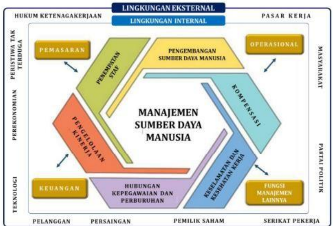
Gambar 2. 8 Enam Bidang Fungsional Sumber Daya Manusia