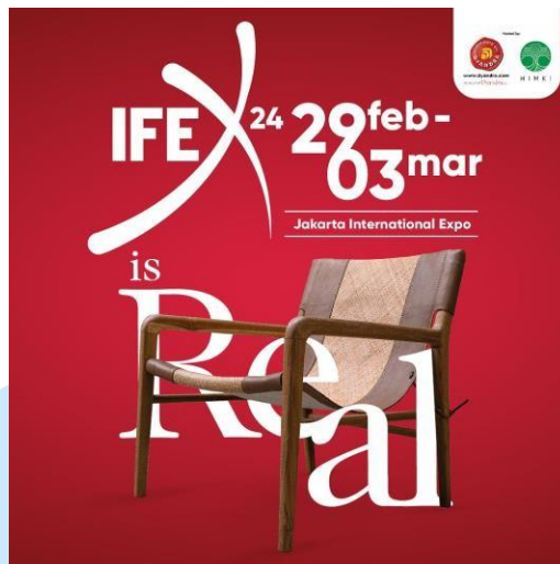
Gambar 2. 3 Indonesia International Furniture Expo 2024

IFEX 2024 diselenggarakan pada 29 Februari - 03 Maret 2024 yang bertempat di JiExpo Kemayoran Jakarta. Mengusung konsep R.E.A.L ( Reflection of the Culture, Experience the Comfort, Adapt to Sustainability, dan Leading the Innovation ), pameran IFEX 2024 terus menjadi platform bagi momentum sempurna bagi produsen lokal untuk menampilkan beragam produk mereka kepada pembeli global.