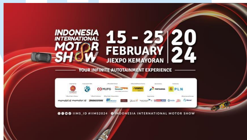
Gambar 2. 2 Indonesia International Motor Show 2024

Sebagai salah satu acara tahunan yang paling ditunggu-tunggu di Indonesia, IIMS selalu menghadirkan terobosan setiap tahunnya, dengan berbagai hal baru dan program menarik yang didedikasikan untuk para pecinta otomotif. Program-program tersebut meliputi pameran mobil, suku cadang dan aksesoris mobil, serta IIMS Movie Cars, IIMS Military Zone, dan IIMS Drift Wars. Pameran otomotif ini juga menghadirkan beragam program lain dengan menggabungkan pameran otomotif dengan berbagai acara hiburan. Tujuannya adalah untuk menarik lebih banyak penonton yang beragam, tidak hanya pecinta otomotif, tetapi juga masyarakat umum secara keseluruhan.