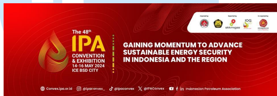
Gambar 2. 5 IPA Convention & Exhibition 2024

pemerintah, pembuat kebijakan, investor, dan masyarakat, acara tahunan ini diharapkan dapat menarik para profesional industri dan energi terkemuka, menawarkan mereka kesempatan utama untuk berjejaring, belajar, dan mencari teknologi terbaru. Konvensi ini menghadirkan berbagai sesi pleno, teknis domain, dan teknologi yang menampilkan pejabat pemerintah terkemuka, pemimpin industri, pemangku kepentingan utama, dan analis kredibel, yang diambil dari pengalaman nyata global. Area pameran yang luas menampilkan teknologi dan inovasi minyak dan gas terbaru, produk dan layanan industri, proyek-proyek penting, memberikan pembaruan dan peluang bisnis bagi industri untuk mendorong Indonesia menjadi kompetitif secara global.