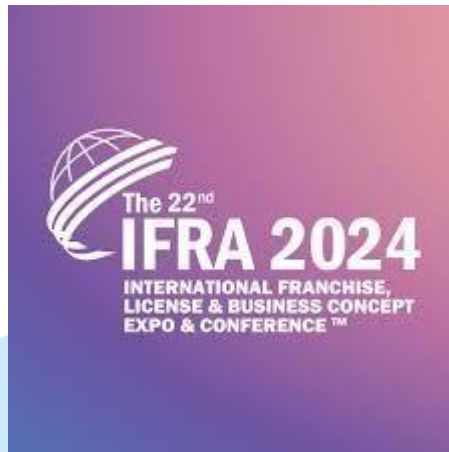
Gambar 2. 6 IFRA 2024

Dengan format yang lengkap dan menarik tersebut, IFRA berhasil menyedot perhatian tidak sedikit pelaku bisnis. Tercatat 180 perusahaan dan 350 merek turut berpartisipasi dalam perhelatan IFRA terbaru. Animo masyarakat pun terbilang tinggi, terbukti dengan kehadiran sekitar 15.000 pengunjung. Angka tersebut berbanding lurus dengan transaksi bisnis yang terjalin, yaitu mencapai Rp 620 miliar. IFRA berkontribusi nyata tidak hanya dalam hal pengembangan bisnis waralaba, tetapi juga turut mendorong pertumbuhan ekonomi nasional.