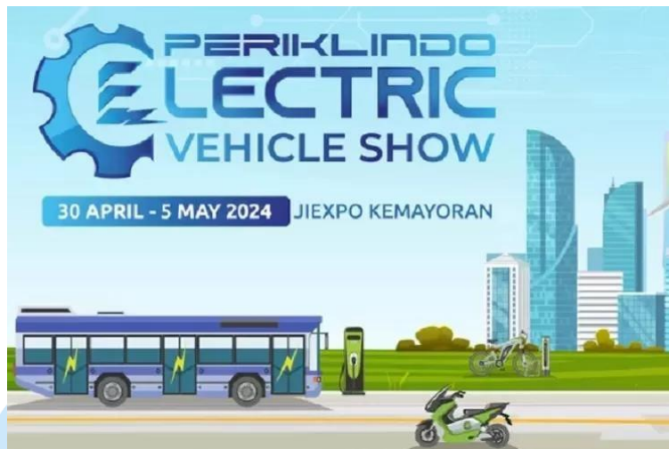
Gambar 2. 4 PERIKLINDO Electric Vehicle Show 2024

Pada tahun 2024, PEVS kembali diadakan pada 30 April - 5 Mei 2024 di JiExpo Kemayoran Jakarta. Pada tahun ketiganya, PEVS 2024 hadir dengan mengusung tagline “ The Leading EV Show in Indonesia ” yang menggambarkan komitmen kami untuk menjadi pemimpin dalam mengencarkan adopsi penggunaan kendaraan listrik di Indonesia. PEVS 2024 hadir dengan berbagai program seperti Miss PEVS, test drive , test ride , dan terdapat closing ceremony pada hari terakhir.