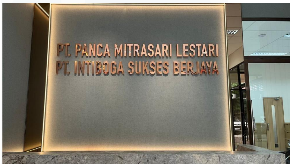
Gambar 2. 2 Fisik Perusahaan

PT. INTIBOGA SUKSES BERJAYA didirikan pada tahun 2021 dengan visi menjadi pemimpin dalam industri Food and Beverage (F&B) di Indonesia.