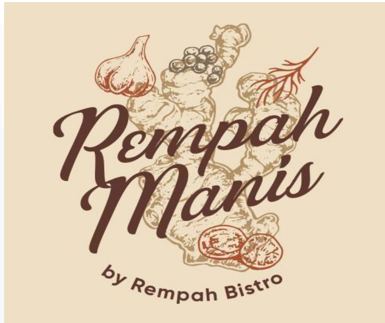
Gambar 2. 3 Logo Rempah Manis