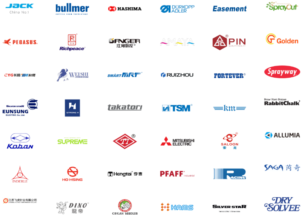
Gambar 2. 2 Suppliers Indohose