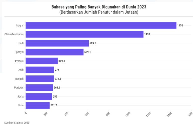
Gambar 1. 1 Bahasa Paling Banyak Digunakan

Dilansir dari berita Bahasa Mandarin merupakan salah satu Bahasa Internasional ke dua setelah Inggris dan berdasarkan data dari Data UNESCO yang rilis pada Tahun 2023 menyatakan Bahasa Mandarin merupakan Bahasa yang paling banyak digunakan yaitu sekitar 1,1 Miliar orang di dunia, yang seperti ditunjukkan pada gambar 1.1 bahasa Paling Banyak digunakan