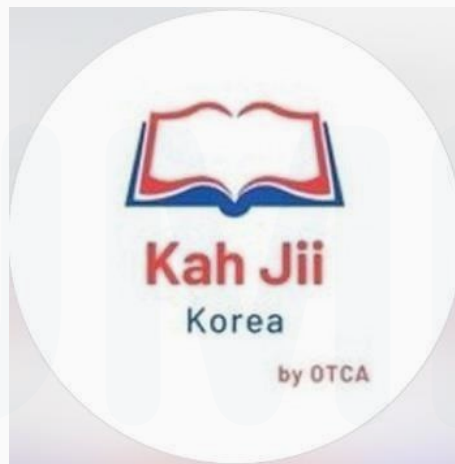
Gambar 2. 3 Logo Kahji Korea

Pada Gambar 2.3 merupakan logo dari Divisi Kahji Korea yang memegang pelajaran bahasa asing bahasa Korea. Didalam Kahji Korea terdapat banyak guru les bahasa korea atau yang sering di sebut SSAEM yang sudah berpengalaman dan memiliki tingkatan level bahasa korea ke III dan juga lulusan kuliah di Korea.