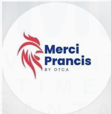
Gambar 2. 5 Logo Merchi Prancis