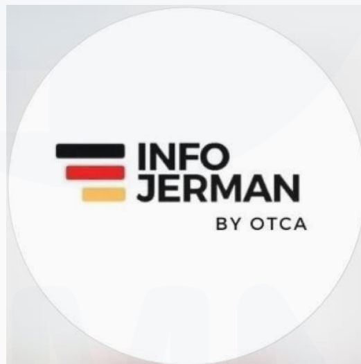
Gambar 2. 6 Logo Info German

Pada gambar 2.6 ditunjukkan merupakan Logo dari Info German yang membimbing atau mengajar bahasa asing yaitu German, Les bahasa Asing German merupakan salah satu Les bahasa asing yang paling laris atau paling banyak diminati banyak orang.