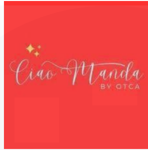
Gambar 2. 2 logo Ciao Manda

Pada gambar 2.2 merupakan logo dari Divisi Ciao manda yang merupakan diisi yang memegang bahasa mandarin, pada divisi Ciao manda memiliki Lao shi atau guru yang suda terpercayai dan juga memiliki sertifikat resmi , dan juga memiliki pengalaman yang cukup banyak mulai dari sudah berkuliah atau lulusan China dan Taiwan, dan yang paling penting memiliki HSK 4 yang merupaka puncak dari HSK dalam bahasa Mandarin.