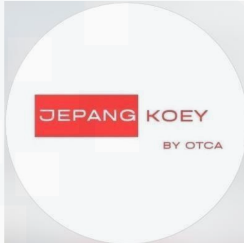
Gambar 2. 4 Logo Jepang Koe

Pada Gambar 2.4 merupakan Gambar dari Logo Jepang Koey yang memegang dalam bahasa Jepang. Jepang Koey ini memiliki banyak Sensei yang membantu para konsumen untuk belajar bahasa jepang dan memiliki tingkatan level yaitu N5 dalam belajar bahasa jepang memiliki tingkat paling sulit.