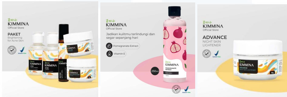
Tabel 2.2 Produk Kimmina Beauty