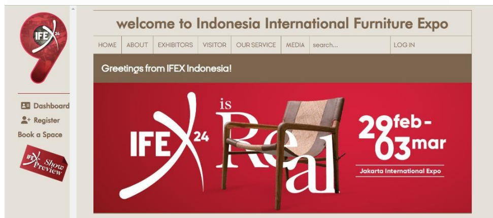
Gambar 2.4 Website Indonesia International Furniture Expo

Indonesia International Furniture Expo (IFEX) merupakan pameran furnitur berskala internasional yang menghadirkan pembeli internasional dan potensi ekonomi yang cukup besar memberikan harapan positif bagi pertumbuhan ekonomi Indonesia. Indonesia International Furniture Expo (IFEX) telah terbukti sebagai pameran furnitur B2B unggulan di Indonesia dan memiliki kontribusi yang cukup signifikan bagi industri furnitur Indonesia. Penyelenggaraan IFEX terbukti memberi pengaruh positif bagi upaya ini yang terlihat dari banyaknya buyers internasional yang hadir selama pameran berlangsung.