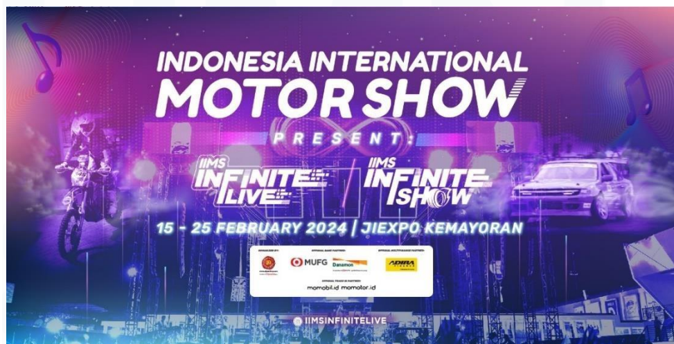
Gambar 2.3 Website Indonesian Motor Show

Indonesia International Motor Show (IIMS) merupakan event pameran otomotif yang juga menyajikan berbagai hiburan di dalam acaranya seperti konser dan booth makanan. IIMS pertama kali digelar oleh PT. Digital Inisiatif (Dyandra Promosindo) sejak tahun 2016 hingga kemarin pada 15-25 Februari 2024 di JIExpo Kemayoran, Jakarta. Acara IIMS tahun ini mengusung tagline “Your Infinite Autotainment Experience”, yang dimaksud bahwa IIMS 2024 akan menciptakan pengalaman tanpa batas bagi pengunjung dalam menjelajahi pameran otomotif dan sajian hiburan yang ada di dalamnya. Selama 11 hari berjalannya acara IIMS di tahun ini, sudah terhitung lebih dari 562.464 pengunjung yang datang dengan 15.000 lebih kendaraan yang terjual di dalam pameran, serta nilai transaksi yang didapatkan sekitar Rp 6.700.000.000,00.