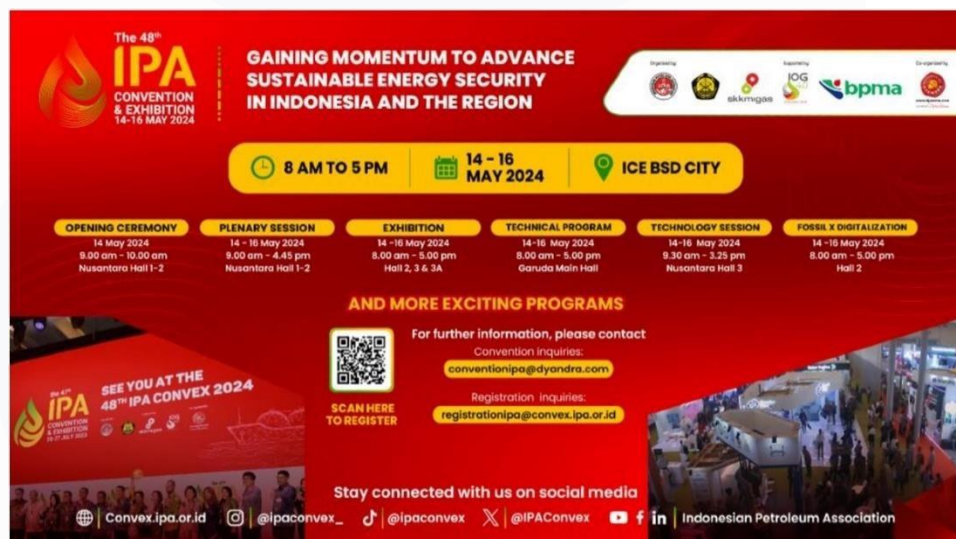
Gambar 2.5 Website Indonesian Petroleum Association

Indonesian Petroleum Association Convention Exhibitiopn (IPA CONVEX) merupakan acara yang mempertemukan para pemain kunci di sektor energi. Ini mencakup para pemimpin industri, pihak-pihak yang terlibat dalam pembelian dan penjualan produk dan layanan terkait energi, serta pejabat pemerintah. Acara ini berfungsi sebagai forum vital untuk pertukaran pengetahuan dan ide seputar transisi energi, yang memiliki dampak mendalam pada lintasan masa depan industri minyak dan gas.