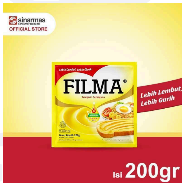
Gambar 2.2 Filma Minyak Goreng