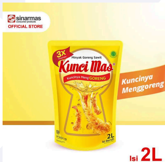
Gambar 2.4 Palmboom Margarine