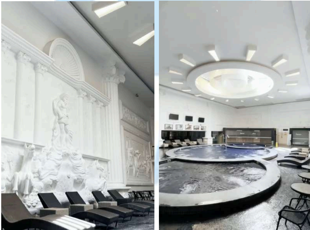
Gambar 2.4 Grand SPA Grand Elite Hotel Pekanbaru

Hotel Pekanbaru juga menyediakan Grand SPA bagi tamu untuk melakukan relaksasi dengan desainnya yang terinspirasi dari The Roman Gods and Goddess . Tidak hanya itu, Grand Elite Hotel Pekanbaru juga menyediakan layanan resepsionis yang siap membantu selama 24 jam untuk memastikan kenyamanan dan kepuasan tamu selama menginap di hotel ini. Dengan kombinasi kualitas dan fasilitas, layanan yang ramah, dan lokasi yang strategis, Grand Elite Hotel Pekanbaru menjadi pilihan ideal bagi para wisatawan dan pengunjung profesional yang mengunjungi kota ini.