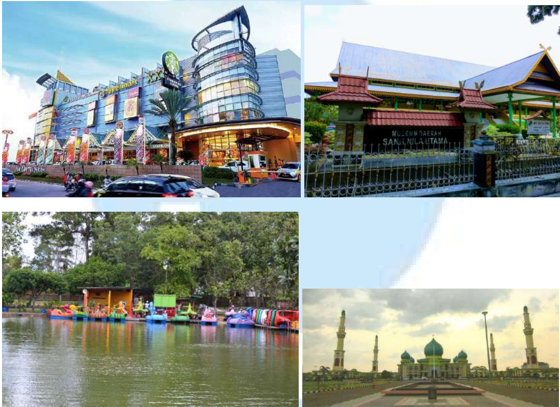
Gambar 2.3 Tempat Wisata di Pekanbaru

Selain aksesibilitas yang mudah, potensi pasar juga menjadi faktor penting dalam pemilihan lokasi pembangunan hotel. Pekanbaru merupakan kota yang berkembang pesat dengan kegiatan bisnis yang meningkat dan pertumbuhan ekonomi yang stabil. Sebagai pusat perdagangan dan industri di Provinsi Riau, Pekanbaru terus menarik investor dan pelaku bisnis dari berbagai daerah, menciptakan permintaan yang tinggi untuk akomodasi berkualitas. Faktor ini membuat lokasi di pusat kota menjadi pilihan strategis untuk mendirikan hotel, karena potensi pasar yang besar untuk menarik tamu dari berbagai latar belakang, baik lokal maupun internasional. Sebagai pusat perdagangan dan industri di Provinsi Riau, kota Pekanbaru menjadi magnet bagi investor dan pebisnis dari segala penjuru, oleh karena itu, permintaan akan akomodasi yang berkualitas pun melonjak tinggi.