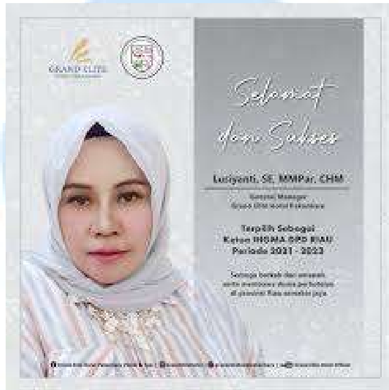
Gambar 2.8 General Manager Grand Elite Hotel Pekanbaru

Selanjutnya, terdapat 9 orang Head of Department yang bertanggung jawab langsung kepada General Manager , yaitu Room Division Manager , Chief Engineering , Director of Sales , Executive Chief , EAM Incharge F&B Manager , HR Manager , Finance Controller , Club Manager , dan Chief Security . Setiap departemen memiliki tugas dan tanggung jawabnya masing-masing yang dipimpin oleh Head of Department dan dibantu oleh anggotanya masing-masing. Setiap departemen harus menjalankan tugas dan tanggung jawabnya dengan baik demi kelancaran operasional hotel.