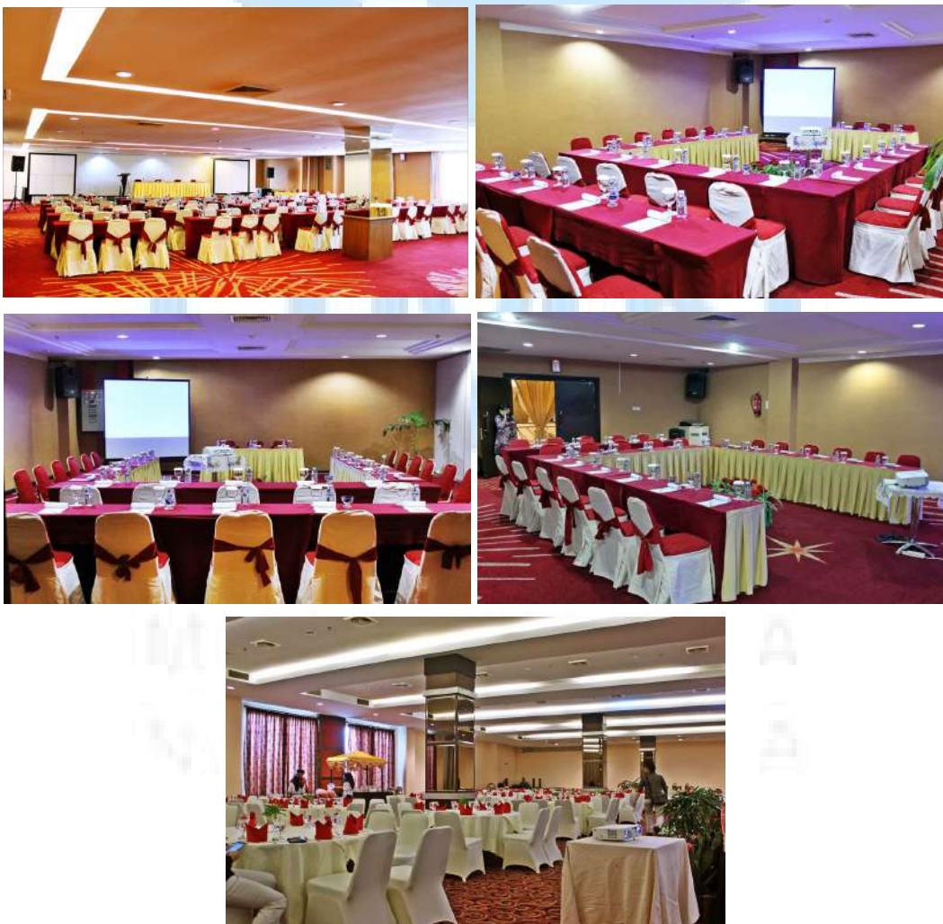
Gambar 2.6 Meeting Room

berbeda-beda. Serampang 12 dan Makyong cocok digunakan untuk acara kecil hingga menengah dengan suasana yang lebih intim, sementara Langgam dan Tanjung Katung menyediakan ruang yang lebih besar dan fleksibel untuk berbagai jenis pertemuan. Balai Ngah dan Balai Cik menghadirkan sentuhan elegan yang ideal untuk seminar atau pelatihan, dan Grand Sultan Ballroom adalah pilihan utama untuk acara besar seperti konferensi atau pernikahan, dengan kapasitas yang mampu menampung ribuan tamu. Dengan fasilitas yang lengkap dan layanan profesional, Grand Elite Hotel Pekanbaru memastikan setiap acara berjalan lancar dan sukses, menjadikannya destinasi unggulan untuk berbagai kebutuhan pertemuan dan acara di Pekanbaru.