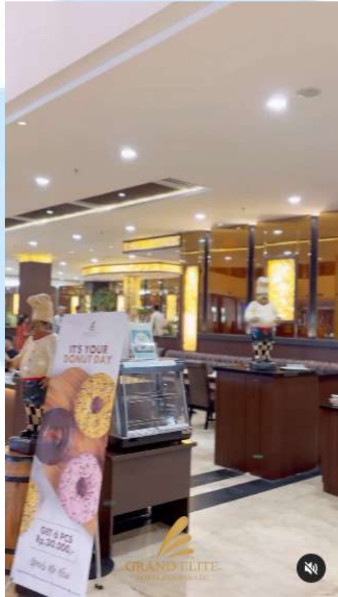
Gambar 2.2 Pepito Restaurant Grand Elite Hotel Pekanbaru

Lokasi Grand Elite Hotel Pekanbaru yang strategis memungkinkan tamu untuk mengunjungi berbagai tempat wisata dengan lebih mudah. Beberapa tempat yang bisa dikunjungi oleh para wisatawan yang menginap di Grand Elite Hotel Pekanbaru adalah Mall Ciputra Seraya, salah satu pusat perbelanjaan terbesar di Pekanbaru yang menawarkan berbagai macam toko, restoran, dan hiburan. Selain itu, para tamu juga dapat mengunjungi Museum Sang Nila Utama, yang menyajikan koleksi seni dan artefak budaya Riau dan dapat memberikan wawasan mendalam tentang sejarah dan tradisi daerah Riau. Tidak jauh dari hotel, juga terdapat Taman Rekreasi Alam Mayang yang merupakan destinasi populer untuk bersantai dengan pemandangan alam yang indah dan berbagai fasilitas rekreasi. Bagi yang tertarik dengan wisata religi, Masjid Agung An-Nur yang megah dengan arsitektur khasnya bisa menjadi pilihan yang menarik. Dengan semua destinasi menarik ini dalam jarak yang dekat, menginap di Grand Elite Hotel Pekanbaru memberikan kemudahan dan kenyamanan bagi wisatawan untuk menjelajahi keindahan kota ini.