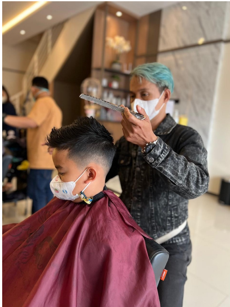
Gambar 2. 5 Kapster

Kapster memiliki peran yang mirip dengan hair stylist, tetapi biasanya fokus pada layanan yang lebih spesifik seperti pemotongan rambut untuk pria, pencukuran, dan perawatan rambut lainnya yang tidak memerlukan tingkat kreativitas dan kompleksitas yang sama seperti hair stylist. Kapster harus ramah dan komunikatif untuk memastikan pelanggan merasa nyaman dan puas dengan layanan yang diberikan.