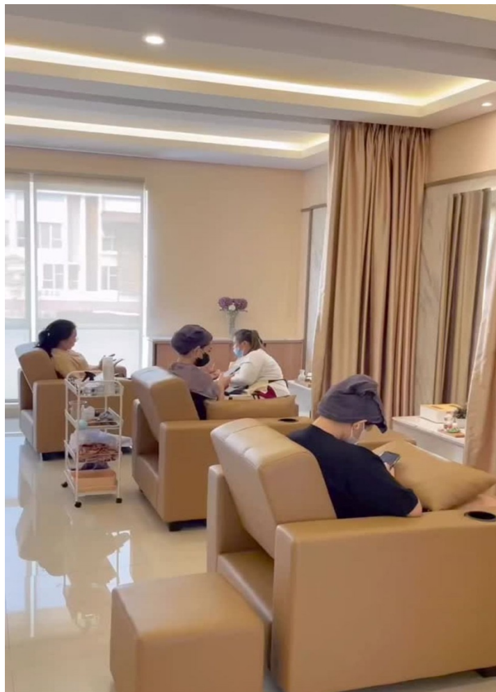
Gambar 2. 6 Therapist

Therapist di salon kecantikan biasanya bertanggung jawab atas berbagai layanan perawatan tubuh seperti pijat, perawatan kulit, facial, dan terapi kecantikan lainnya. Mereka harus terlatih dalam teknik-teknik terapi tertentu dan memiliki pengetahuan mendalam tentang produk dan prosedur perawatan. Therapist fokus pada meningkatkan kesejahteraan dan relaksasi pelanggan melalui layanan yang diberikan.