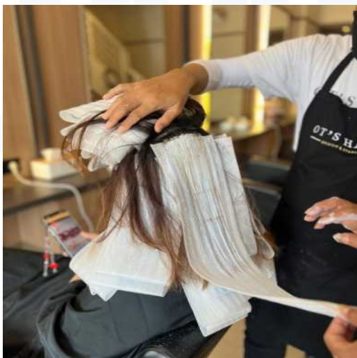
Gambar 2. 4 Hair Stylist

Hair stylist adalah profesional yang bertugas menangani pemotongan, pewarnaan, penataan rambut, dan layanan terkait lainnya. Mereka bertanggung jawab untuk memahami kebutuhan dan keinginan pelanggan serta memberikan saran terbaik untuk gaya rambut yang sesuai. Hair stylist harus memiliki kreativitas tinggi dan keterampilan teknis yang mendalam dalam berbagai teknik penataan rambut.