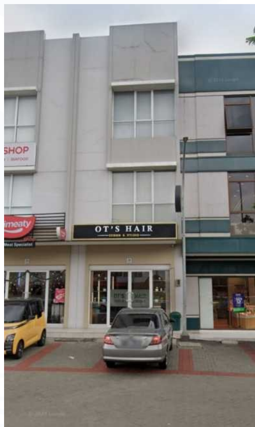
Gambar 2. 1 Salon Ot's Hair