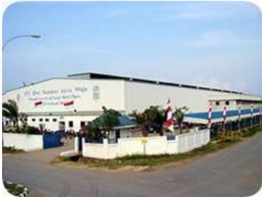
Gambar 2. 2 Foto Pabrik PT Dwi Sumber Arca Waja

Lokasi strategis pabrik di Batam dekat dengan Singapura, memberikan keunggulan logistik yang signifikan bagi PT Dwi Sumber Arca Waja, memungkinkannya untuk dengan cepat dan efisien memenuhi permintaan pasar regional dan internasional.