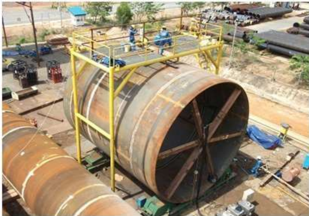
Gambar 2. 3 Produk PT Dwi Sumber Arca Waja

Produk PT Dwi Sumber Arca Waja, telah membangun reputasi yang tak tertandingi dalam mendukung industri minyak dan gas bumi. Dengan tim tenaga kerja yang berpengalaman dan terlatih, PT. DSAW telah memperjuangkan posisinya sebagai pilihan utama dalam pembuatan pipa baja berukuran besar. Produk unggulan dari PT. DSAW, seperti jack up barge leg yang menampilkan keunggulan dalam spesifikasi yang luar biasa. Dengan diameter 3,5 meter, panjang 90 meter, dan memiliki tebal 58-65 milimeter, serta berat per unit mencapai 450 metric ton. Produk ini telah menjadi andalan perusahaan dalam rentang waktu sejak tahun 2006 hingga saat ini.