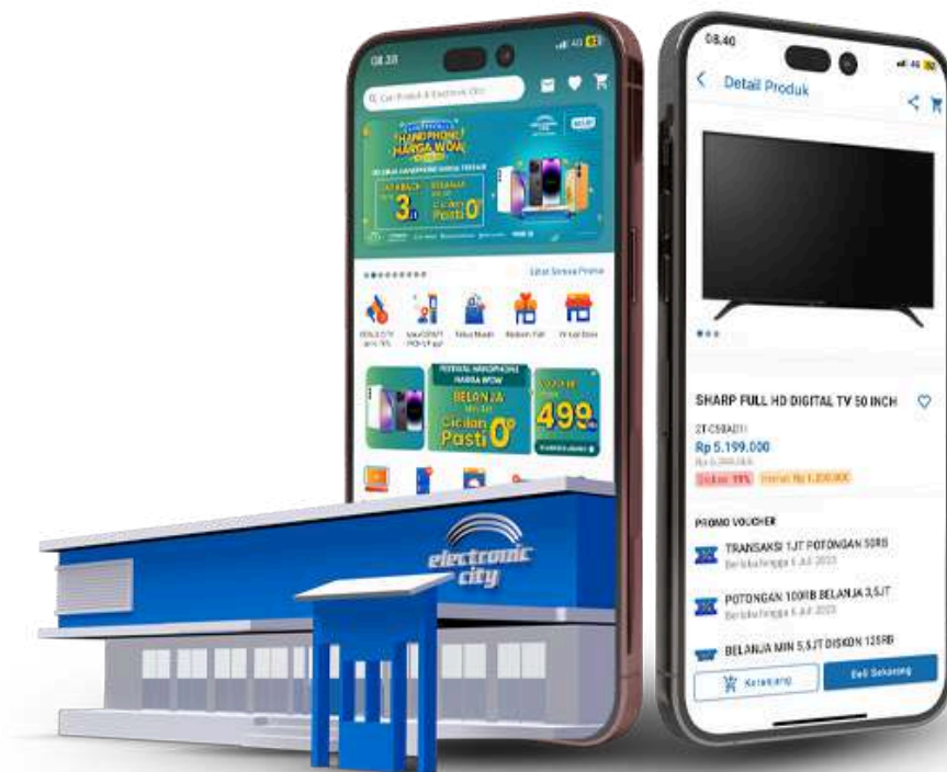
Gambar 2.5 Tampilan Aplikasi eci.id