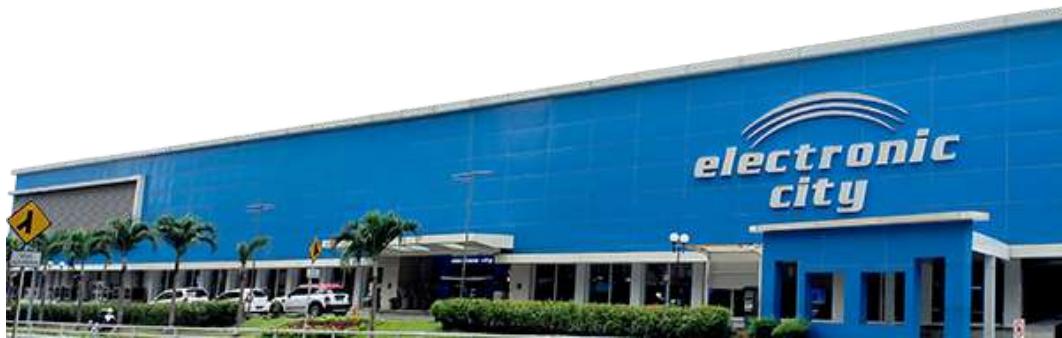
Gambar 2.2 Toko Pertama PT. Electronic City Indonesia Tbk di kawasan Sudirman Central Business District (SCBD), Jakarta