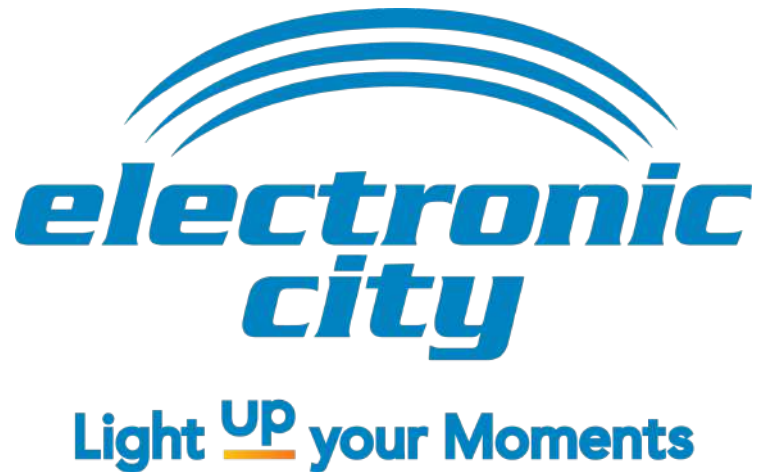
Gambar 2.1 Logo dan Tagline PT. Electronic City Indonesia Tbk