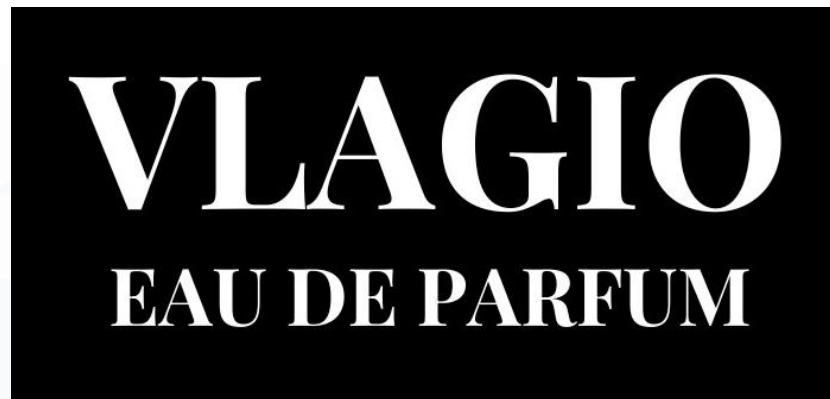
Gambar 2. 2 Thai Fuku Honor Vlagio