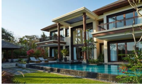
Gambar 2.8 Villa Golf Bali National Golf Club

Pada gambar 2.8 merupakan gambar dari villa yang tersedia di Bali National Golf Club. terdapat 7 Luxury villa yang ada di Bali national Golf club yang terdiri dari berapa tipe villa, yaitu Presidential villa, 3 Bedroom Villa, dan 2 Bedroom villa. Customer yang menginap di villa ini akan disugahi beberapa fasilitas mewah yang akan membuat pengalaman menginap customer tidak akan terlupakan. Para customer juga disugahi pemandangan indah dari hole 17 dan 18 yang berada tepat di halaman belakang villa.