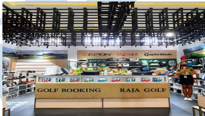
Gambar 2.4 Pro Shop Bali National Golf Club

Pada gambar 2.4 diatas, merupakan gambar dari Pro Shop yang ada oleh Bali National Golf Club. Pro Shop sendiri merupakan tempat yang menyediakan berbagai macam peralatan golf seperti stick golf, bola golf, baju golf, dan peralatan golf lainnya yang memenuhi keperluan golf customer . Selain sebagai tempat peralatan golf, Pro Shop juga menjadi tempat untuk para customer untuk melakukan bookingan / pendaftaran jika ingin bermain golf.