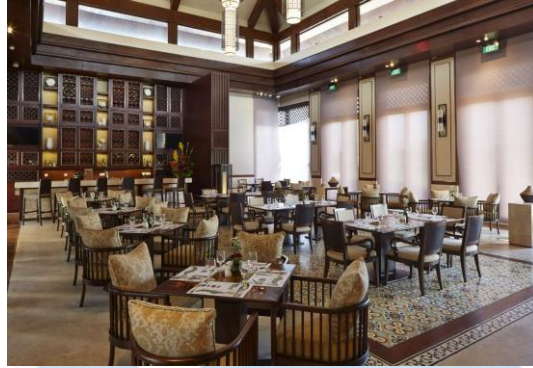
Gambar 2.5 Restaurant Bali National Golf Club

Pada gambar 2.5 diatas, merupakan gambar dari restaurant yang dimiliki oleh Bali National Golf Club. Restoran ini memiliki teras outdoor yang menghadap langsung ke lapangan golf dan terhubung langsung ke tempat starter / tempat para pemain bersiap untuk bermain golf. Pada saat event berlangsung, restaurant ini biasanya menjadi tempat untuk para peserta berkumpul untuk sarapan di pagi hari sebelum bermain golf dan bisa menjadi tempat lunch setelah para pemain selesai bermain golf.