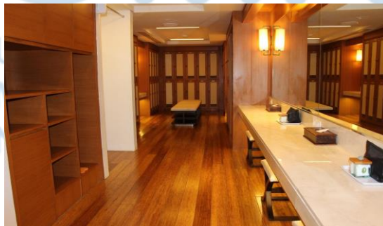
Gambar 2.6 Locker Room Bali National Golf Club