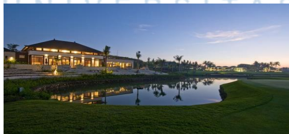
Gambar 2.3 ClubHouse Bali National Golf Club

ClubHouse merupakan fasilitas utama yang dimiliki setiap penyedia lapangan golf, tempat ini berfungsi sebagai titik kumpul bagi para golfer sebelum turun kelapangan dan tempat berkumpul sesudah selesai bermain golf.