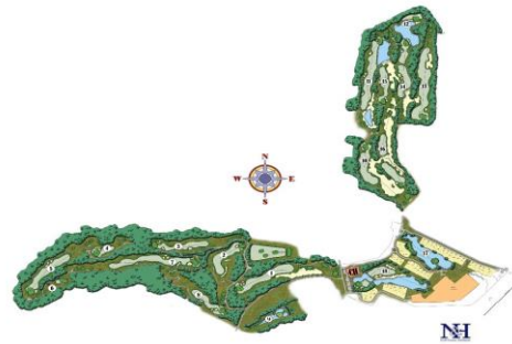
Gambar 2.2 Lapangan Golf Bali National Golf Club

Pada gambar 2.2 merupakan gambar denah lapangan Golf yang dimiliki Bali National Golf Club, lapangan ini merupakan salah satu lapangan dengan standar internasional terbaik di Asia Tenggara yang memiliki 18 hole dengan luas 112 hektar. Lapangan ini merupakan salah satu destinasi terbaik yang dapat dinikmati oleh para pecinta golf yang sedang berlibur ke Bali.