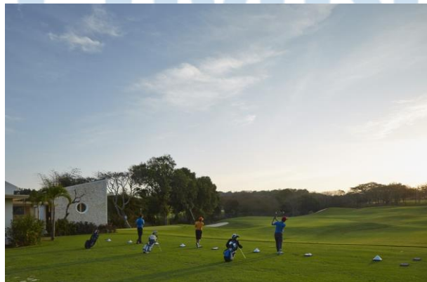
Gambar 2.9 Practice Range Golf Bali National Golf Club