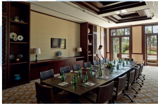
Gambar 2.7 Vip Meeting Room Bali National Golf Club

Selain sebagai tempat untuk para pemain golf untuk bersantai sebelum dan sesudah bermain golf, dilihat dari gambar 2.7 di ClubHouse juga terdapat ruangan VIP Meeting Room yang dapat digunakan oleh perusahaan/sekelompok orang untuk melakukan Meeting / melaksanakan private event yang dilaksanakan di Bali National Golf Club.