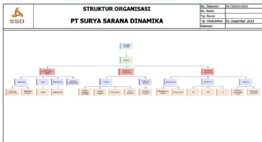
Gambar 2. 8 Struktur Organisasi Perusahaan