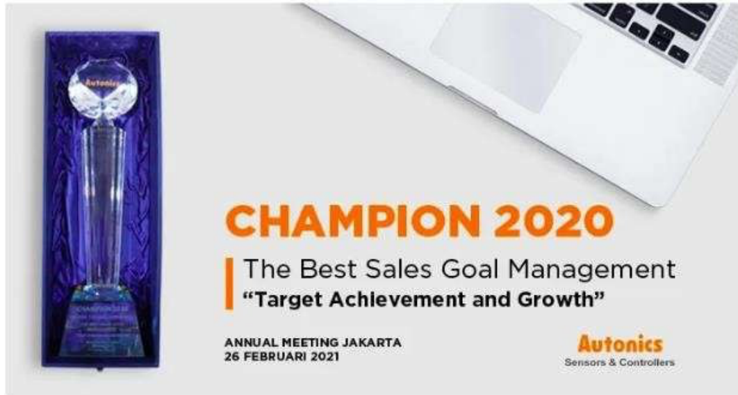
Gambar 2. 5 Salah Satu Penghargaan PT Surya Sarana Dinamika

berhasil berkembang sebagai perusahaan supplier robotika dan otomasi nomor 1 untuk Autonics .