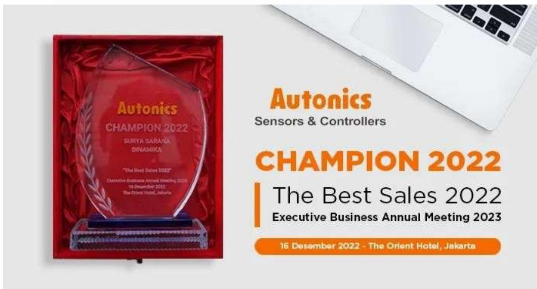
Gambar 2. 6 Penghargaan berturut-turut