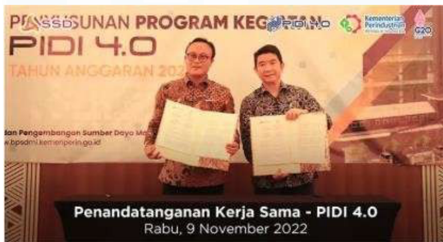
Gambar 2. 7 Penandatanganan Kerja Sama PIDI 4.0

Penghargaan kedua yang diberikan kepada PT Surya Sarana Dinamika adalah penghargaan yang sama dengan tahun 2021. Tetapi yang menjadi kebanggaan adalah mendapatkan penghargaan sampai 3 kali berturut-turut, itu artinya perusahaan ini sangat stabil dalam sisi perkembangan. Hal ini juga diakui karena PIDI juga memberikan kepercayaan terkait dengan perkembangan PIDI 4.0 ke PT Surya Sarana Dinamika.