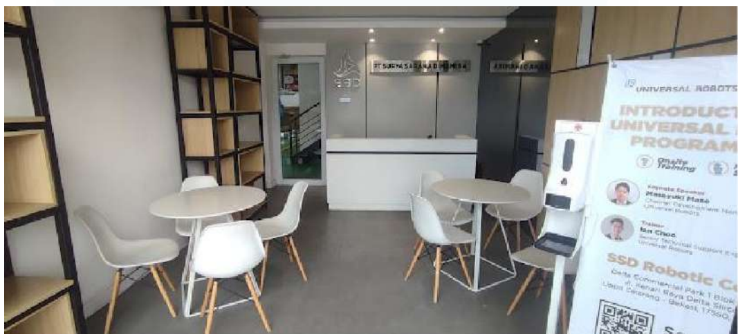
Gambar 2. 4 Branch Office Cikarang

Sejak itu, perusahaan terus berkembang dan memperluas jangkauan mereka, menjangkau lebih banyak perusahaan manufaktur di berbagai wilayah di Indonesia. Dengan membuka cabang baru di Surabaya pada tahun 2018, PT Surya Sarana Dinamika menegaskan posisinya sebagai salah satu pemimpin di industri otomasi dan robotik di Indonesia. Sampai saat ini PT Surya Sarana Dinamika atau yang biasa disebut SSD Automation & Robotic Solution memiliki 5 Cabang untuk menunjang kinerja perusahaan dan menjangkau perusahaan manufaktur secara lebih luas lagi.