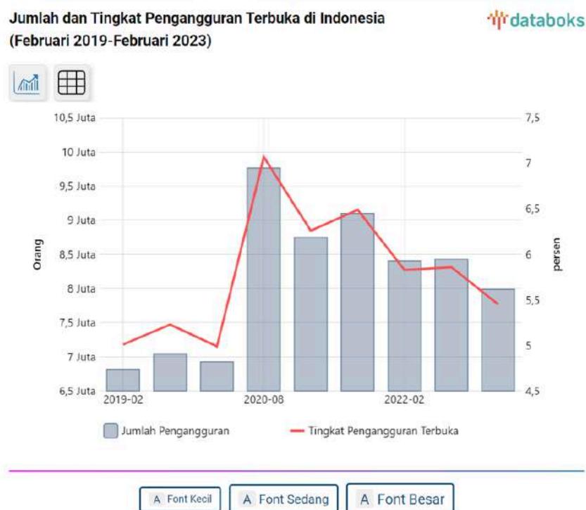
Gambar 1.2 Jumlah Pengangguran di Indonesia tahun 2019-2023

Meskipun mengalami penurunan, angka pengangguran pada Februari 2023 masih lebih tinggi dibandingkan sebelum pandemi. Jika dibandingkan dengan Februari 2019, jumlah pengangguran pada awal tahun 2023 ini bertambah sekitar 1,2 juta orang. Alhasil, pemerintah tetap perlu memulihkan tingkat pengangguran pasca pandemi ini secara konsisten dengan berbagai macam cara, salah satunya dengan mendorong program magang Human Resource Intern .