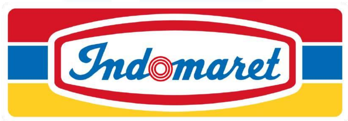
Gambar 2.1 Logo Indomaret

PT Indomarco Prismatama, lebih dikenal dengan merek dagangnya Indomaret, adalah salah satu jaringan minimarket terbesar dan paling dikenal di Indonesia. Perusahaan ini didirikan pada tahun 1988 oleh Salim Group, salah satu konglomerat terbesar di Indonesia yang memiliki berbagai bisnis di sektor pangan, ritel, properti, dan lain-lain. Indomaret memulai perjalanannya dengan membuka toko pertama di Ancol, Jakarta Utara. Tujuan utama pendirian Indomaret adalah untuk menyediakan kebutuhan sehari-hari masyarakat dengan cara yang mudah dan hemat. Konsep minimarket yang diusung oleh Indomaret adalah untuk memudahkan konsumen dalam berbelanja kebutuhan pokok dan produk lainnya dalam satu tempat yang nyaman dan strategis.