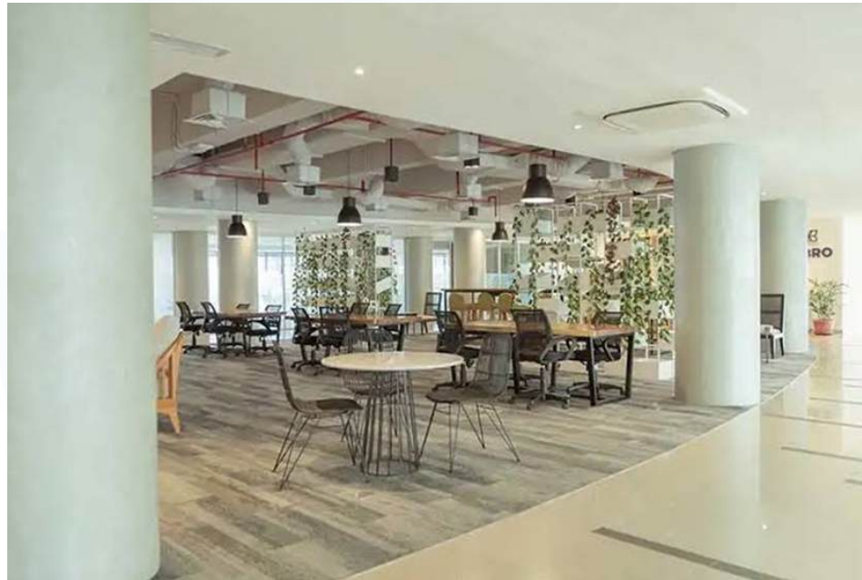
Gambar 2.3 Cooperate Working Space

kemampuan dan keahlian yang sesuai dengan kebutuhan untuk memulai dan mengembangkan perusahaan.