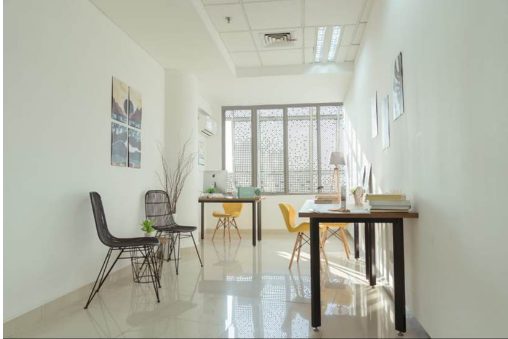
Gambar 2.5 Private Office