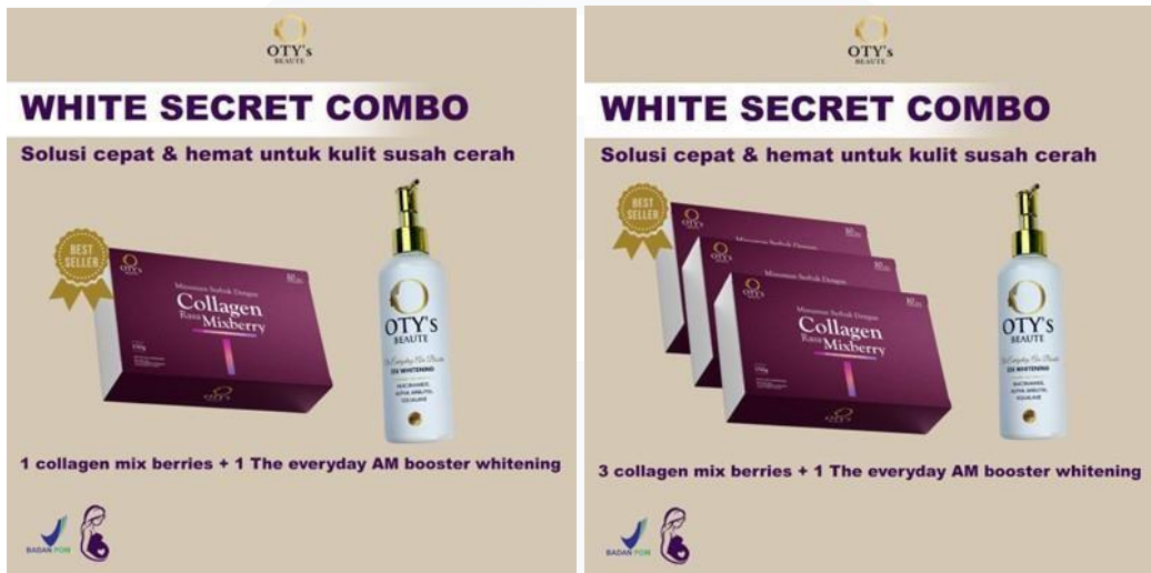
Gambar 2.4 Produk Kolagen Bundling Mixberry dan Lotion Otys Beautyte