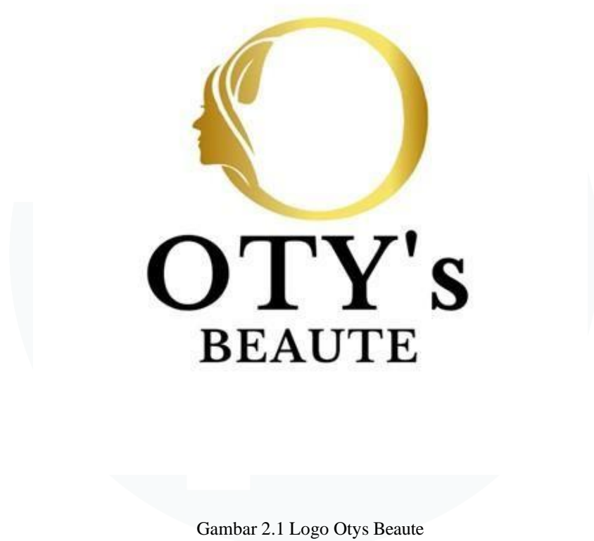
Gambar 2.1 Logo Otys Beaute