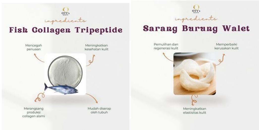
Gambar 2.6 Manfaat yang Terkandung dalam Minuman Kolagen Otys Beaute