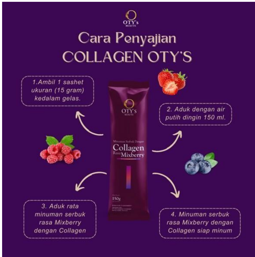
Gambar 2.5 Cara Penyajian Minuman Kolagen Otys Beaute