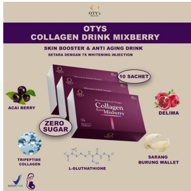
Gambar 2.2 Produk Kolagen Minuman MixBerry Otys Beaute