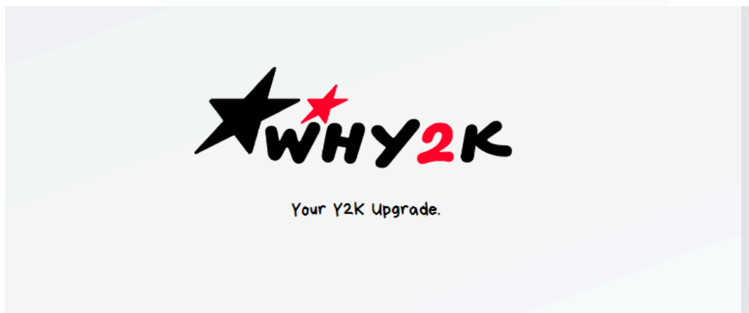
Gambar 2.1 1 Logo Why2k

Why2k adalah salah satu bisnis startup yang diwadahi oleh Skystar Ventures yang didirikan oleh Universitas Multimedia Nusantara (UMN) sebagai wadah wirausaha, selain itu Skystar Ventures juga didukung oleh Kompas Gramedia Group. Skystar Ventures sendiri sudah terakreditasi sebagai inkubator bisnis terbaik yang ada di Indonesia dari Kemenristekdikti. Skystar Ventures mempunyai tujuan yaitu mendorong pertumbuhan ekosistem pada start-up yang berkolaboratif di Indonesia dengan tiga pilar utama, yang mana Incubator Program, Coworking Space, serta Venture Capital.