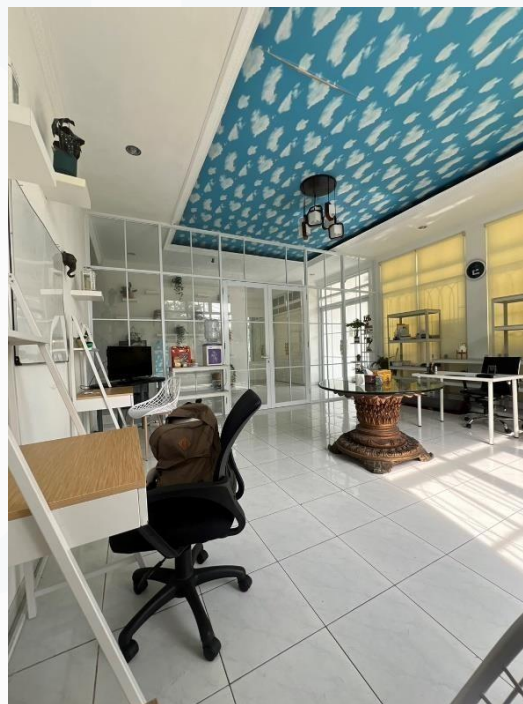
Gambar 2.2 Lingkungan Perusahaan

Secara keseluruhan, lingkungan kerja di PT Engio Recruitment menciptakan atmosfer yang mendukung pertumbuhan dan pembelajaran bagi anggota tim. Dinamika yang ada mencerminkan pentingnya adaptabilitas dalam menghadapi perubahan serta kolaborasi dalam mencapai tujuan bersama.