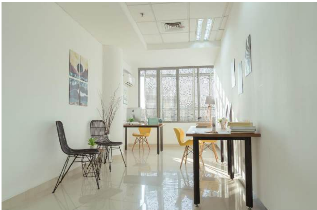
Gambar 2.5 Private Office Space