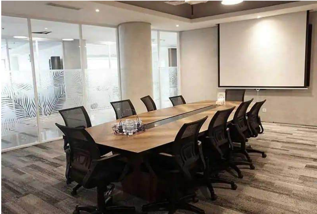
Gambar 2.4 Meeting and Event Space