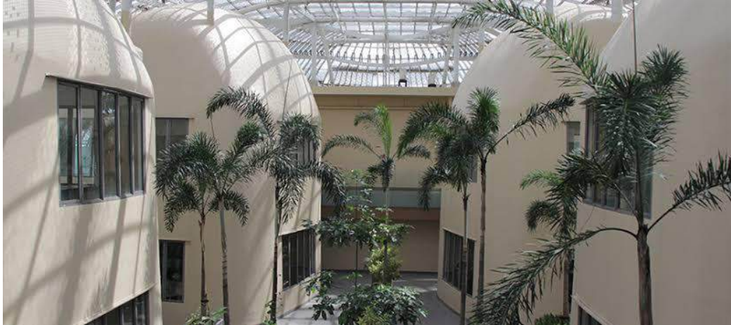
Gambar 2.2 Fasilitas Inkubator bisnis Skystar Ventures

pendiri startup bersama dengan tim yang terlibat, memfasilitasi kolaborasi, rapat, dan acara konferensi bagi para kolaborator, pelaku bisnis startup . Serta mempersilahkan ruang rapat yang ada untuk di sewakan kepada publik.